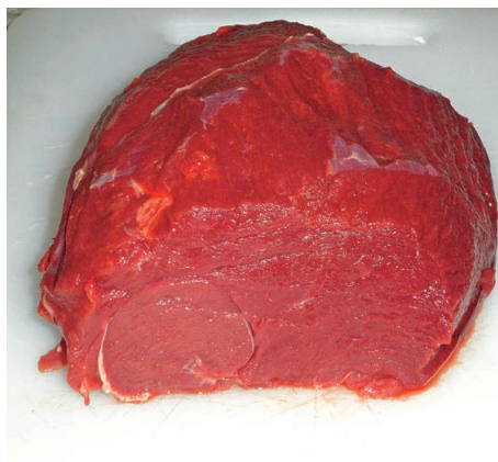
Wildfleisch für die Beurteilung der Fleischqualität.

D urch die Medien wirken heute viele Informationen im Zusammenhang mit gesunder Ernährung auf den Konsumenten ein. Durch diese Informationsflut werden viele Konsumenten zunehmend kritischer und sensibler, wie die Lebensmittel produziert bzw. erzeugt werden (Prozessqualität). Gefordert wird vom Konsumenten unter anderem artgerechte Tierhaltung, stressfreie Tötung (vermeiden von unnötigem Tierleid) sowie die Rückverfolgbarkeit der Prozessabläufe zur Erzeugung der Lebensmittel. Zusätzlich nehmen Ethik, Tierwohl sowie regionale Herkunft bei den Konsumenten einen hohen Stellenwert ein, in Erwartung zu dem Produkt (Lebensmittel) auch ein Stück Heimat (Identitäts-Verbundenheit) zu konsumieren.