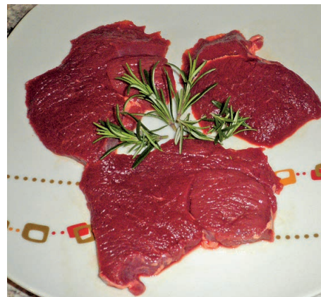
Wildfleisch-Qualität ist objektiv messbar.