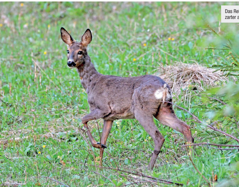
Das Rehfleisch war wesentlich zarter als das Fleisch vom Rotwild.

hatten ein deutliches zarteres Fleisch als ältere Tiere (über 1 Jahr alt). Beim Rehwild war der intramuskuläre Fettgehalt (IMF) im Herbst deutlich höher als im Frühjahr. Das ist wahrscheinlich darauf zurückzuführen, dass die Rehe im Herbst Depotfett als Energiereserve für den Winter ansetzen. Beim Rotwild war der IMF-Gehalt im Frühjahr und Herbst ähnlich hoch. Bei anderen Tierarten mit höheren IMF-Gehalten (z. B. Rinder) führt in der Regel ein höherer IMF-Gehalt zu einer verbesserten Zartheit des Fleisches. Bei Reh- und Rotwild, wo der IMF prinzipiell sehr niedrig ist, hat er aber anscheinend keine große Auswirkung auf die Zartheit. Im Allgemeinen lässt sich sagen, dass das Wildfleisch eine ausgezeichnete Zartheit aufweist.