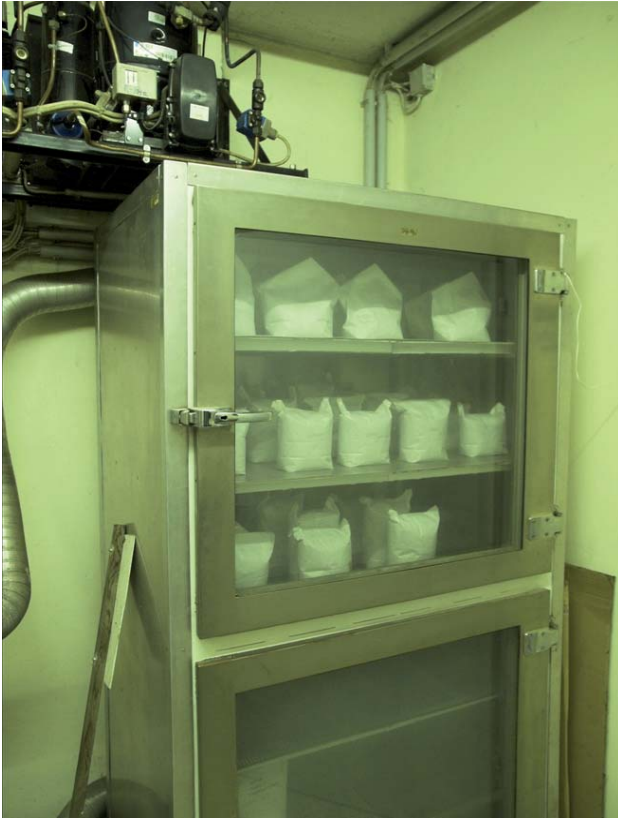
Abbildung 2: Ansicht des Trockenschrankes der Österreichischen Agentur für Gesundheit und Ernährungssicherheit GmbH, Abteilung Pflanzengenetische Ressourcen in Linz

Abteilung Pflanzengenetische Ressourcen in Linz besucht, um die dortige Arbeitsweise zur Sammlung, Erhaltung, Beschreibung und Dokumentation von pflanzengenetischen Ressourcen kennenzulernen und so weit wie möglich zu übernehmen.