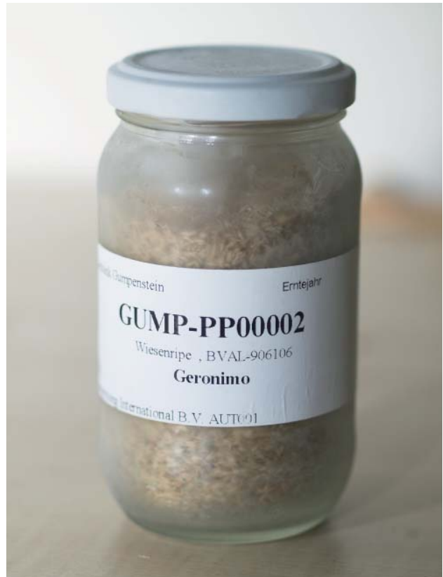
Abbildung 8: Schraubglas mit Etikette (Details aus der Datenbank werden aufgedruckt)