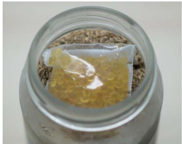
Abbildung 5: Schraubglas mit Saatgut und Silikagel gefülltem Plastiksäckchen

In den Gläsern wird neben dem Saatgut auch ein kleines Plastiksäckchen mit Silikagel eingelagert um eventuell eintretende Feuchtigkeit zu binden (Abbildung 5).