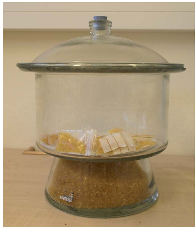
Abbildung 9: Exikator zur Lagerung von mit Silikagel gefüllten Plastiksäckchen