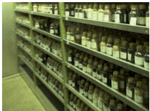
Abbildung 1: Saatgut in Gläsern mit Korkverschluss im Gefrierlager der Abteilung Pflanzengenetische Ressourcen in Linz

Um ein Ex-situ Lager einzurichten, mussten Investitionen für die Saatguttrocknung auf ca. 5% Restfeuchtigkeit des Materials und die Langzeitlagerung getroffen werden (Guerrant et al. 2004). Dazu wurde das langjährige Know-how der Österreichischen Agentur für Gesundheit und Ernährungssicherheit GmbH,