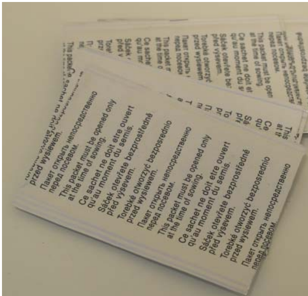
Abbildung 7: Aluminiumsäcke mit PE-Beschichtung (Druckverschlussbeutel mit 40 x 60 mm)

geringes und platzsparendes Lagerung der Akzessionen im räumlich getrennten Sicherheitslager der Abteilung für Pflanzengenetische Ressourcen in Linz.