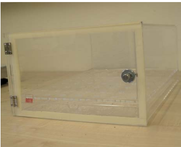
Abbildung 3: Rotilabo Trockenschrank aus Plexiglas mit verschließbarer Tür

Für die Trocknung der Saatgutproben wurde ein Trockenschrank aus Plexiglas besorgt (Rotilabo 410 x 305 x 175 mm), der einen doppelten Boden aufweist (Abbildung 3).