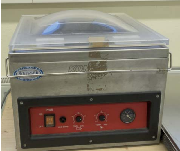
Abbildung 6: Vakuumiergerät zum Einschweißen des Saatgutes in beschichtete Aluminiumsäcke

Für ein externes Sicherheitslager wurden Aluminiumsäcke mit PE-Beschichtung (Druckverschlussbeutel mit 40 x 60 mm) zugekauft, mit denen geringe Mengen des Saatgutes vakuumverpackt und verschweißt werden (Abbildung 6). Dies ermöglicht ein mengenmäßig