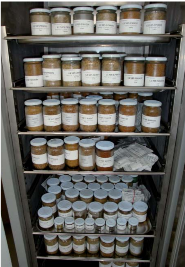
Abbildung 10: Gewerbegefrierschrank als Sicherheitslager an der HBLFA Raumberg-Gumpenstein

Die Gläser und Aluminiumsäcke werden mit Etiketten beklebt, bei denen Feuchtigkeit keinen Einfluss auf die Lesbarkeit ausübt (Abbildung 7 und 8).