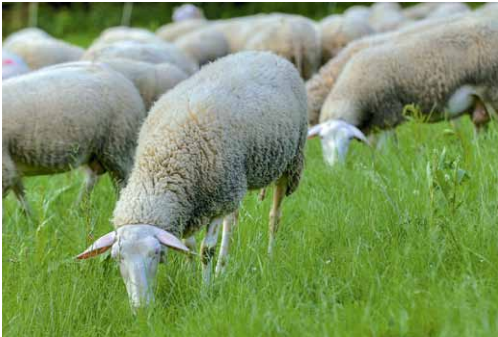
Sind Schafe mit Endoparasiten belastet, wirkt sich dies negativ auf die Fleisch- und Milchleistung aus.