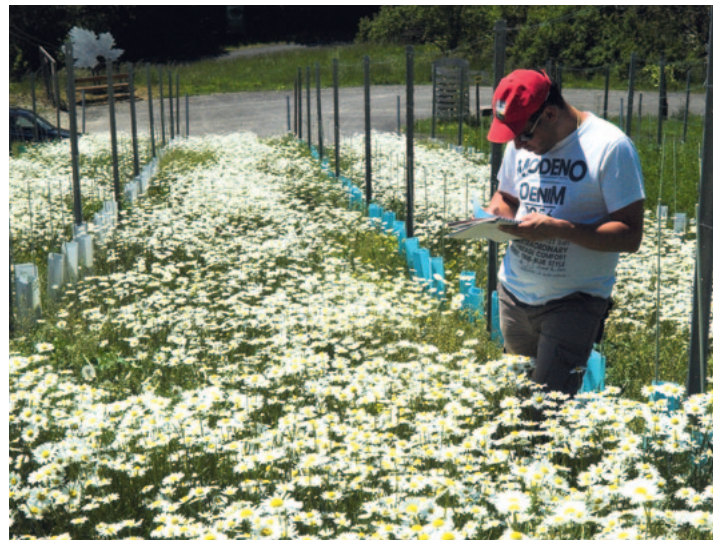
Abb. 4: Dauerbegrünungsmischung W3 zwei Jahre nach der Anlage

Anlage und Nachsaat von Grünlandbeständen entwickelt worden sind, lassen sich auch im Obstbau Dauerbegrünungen nach dem heutigen Stand der Technik etablieren. Regelmäßige Nachsaat solcher Bestände hilft auch bei starker Beanspruchung, Lücken wieder zu schließen und einen hohen Anteil erwünschter Arten und Sorten in den Begrünungen zu erhalten.