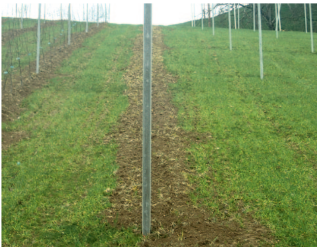
Abb. 1: Bei Pflanzung nach der Einsaat ist die Begrünungsmischung bereits etabliert