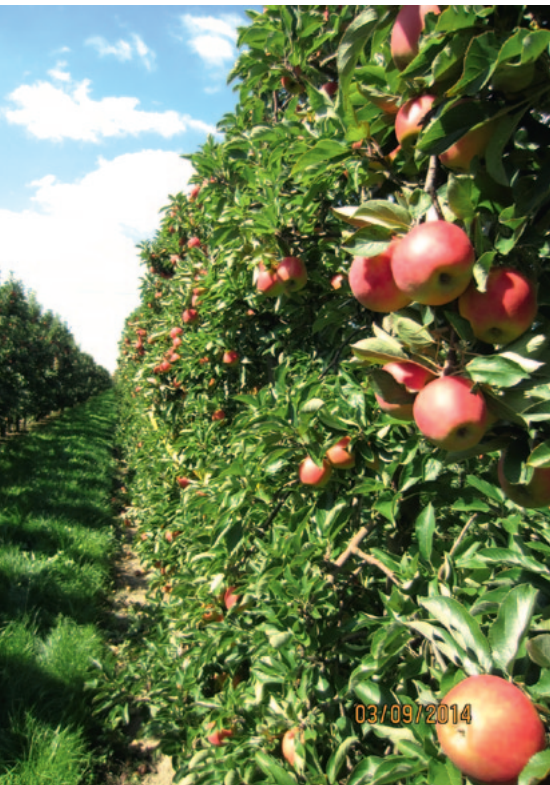
Abb. 6: 11jährige Elstar Elshof-Anlage nach 4 Jahren maschinellem Schnitt