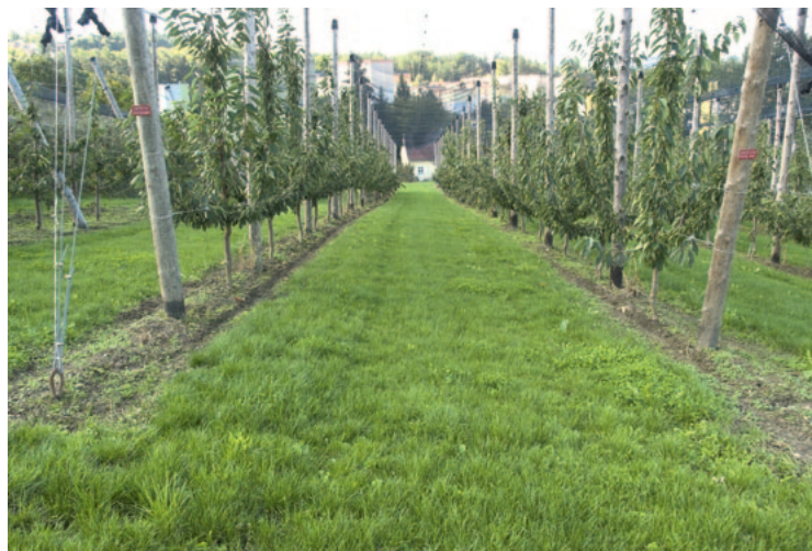
Abb. 2: Kurzwüchsige, biomassearme Begrünungsmischung aus Rasensorten

den Boden kann auch bei Einsatz von gängigen Drill-Sämaschinen aus dem Ackerbau leicht passieren.