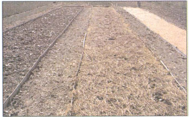
Hochwurzten, Schladming: Auf drei Parzellen wurden jedes Jahr unterschiedliche Begrünungstechniken auf Oberflächenabfluss und Bodenabtrag in den Wochen nach der Begrünung untersucht

Prinzipiell sollte man zwischen kurzfristigen und langfristigen Begrünungszielen unterscheiden. Das wesentliche kurzfristige Ziel liegt im