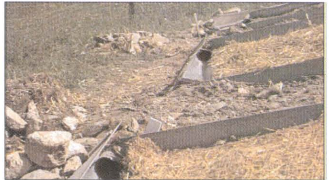
Hochwurzeln, Schlädming: In den Wochen nach der Begrünung analysierten Experten jedes Jahr verschiedene Begrünungstechniken nach detaillierten Gesichtspunkten

Der vorhandene Oberboden soll am Beginn der baulichen Aktivitäten sorgsam abgezogen und gelagert werden. Das darin enthaltene