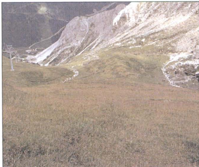
Standortgerechte Saatgutmischungen sind eine Voraussetzung für langfristigen Erosionsschutz (Gamsleitn II, Obertauern)

Der Oberflächen-Abfluss sowie der Bodenabtrag wurden in Abhängigkeit von den natürlichen Niederschlags-Verhältnissen des Standortes geprüft.