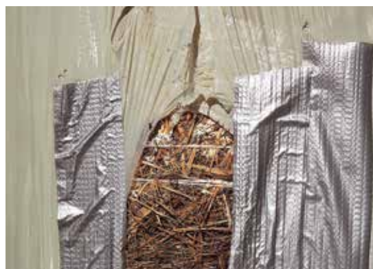
Der Eintritt von Luft oder Wasser bedeutet das Ende für die Haltbarkeit des Futters.

Heu und Grummet laufen Gefahr zu verderben, wenn die Feuchtigkeit im Futter mehr als 14 % beträgt. Getrocknetes Heu muss daher auch am Lager vor Wasser geschützt werden. Vermeiden Sie unbedingt Bodenkontakt und Wassereintritt in das Lager. Sporenbildende Schimmelpilze (Aspergillen, Wallemia, Mucorales) sorgen bei zu hoher Feuchtigkeit für eine Lagerverpilzung, wodurch das Heu meist muffig riecht und staubt. Diese Pilze könnten auch giftige Mykotoxine bilden, die Tier und Mensch krank machen können. Darüber hinaus können Lagerschädlinge wie Heumotten und Spinnmilben die Heuqualität mit zunehmender Lagerdauer verschlechtern.