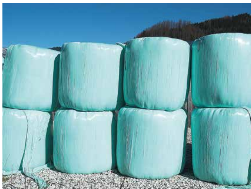
Wollen Sie Silagereserven anlegen, sollten Sie die Ballen möglichst lichtgeschützt lagern.

Reinhard Resch und Stefanie Gappmaier forschen an der HBLFA Raumberg-Gumpenstein.