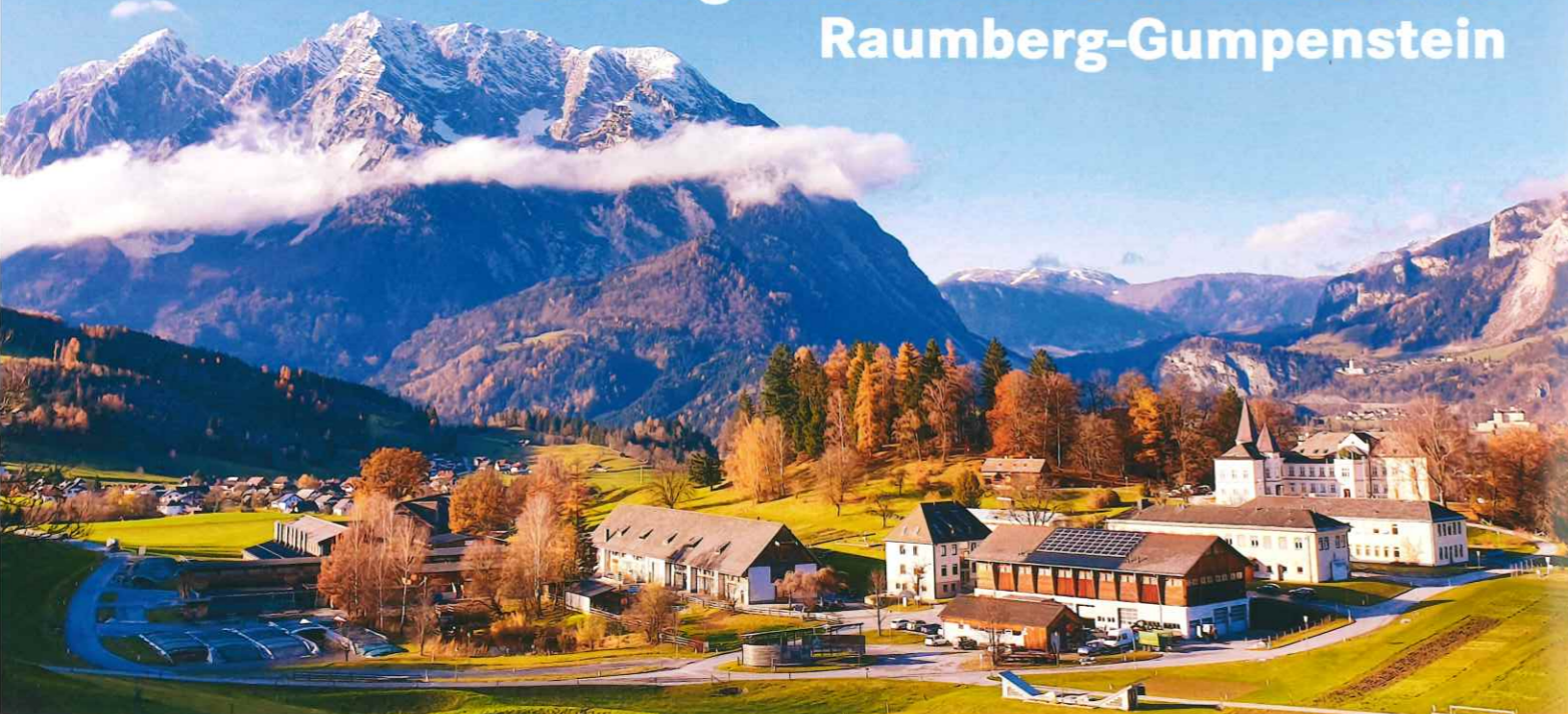
Schloss Gumpenstein mit den weitläufigen Forschungseinrichtungen | Alle nicht bezeichneten Fotos: HBLFA Raumberg-Gumpenstein

Letztes Jahr feierte die HBLFA Raumberg-Gumpenstein ihr 75-jähriges Bestehen. Grund genug, um auch die Frauen in der Forschung vor den Vorhang zu holen und ihre Leistungen in Kurzporträts vorzustellen.