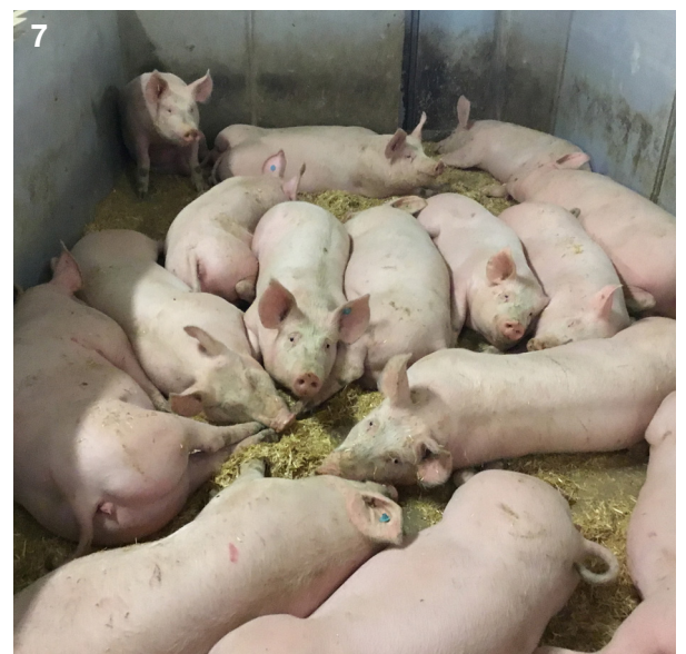
7 Schweine wühlen gerne in Stroh, kauen und nagen daran herum oder schieben das Beschäftigungsmaterial umher. Allerdings reagieren sie empfindlich auf den dadurch aufgewirbelten Staub.

Die Staubbelastung auf dem getesteten Schweinemastbetrieb wechselte im Tagesverlauf. Für das höhere Staubaufkommen sorgten der Landwirt, in dem er die Buchten einstreute und die wechselnde Aktivität der Schweine. Mit der Sprühanlage, die den Tag über mehrfach aktiviert wurde, ließ sich das Partikelauftreten in der Luft schließlich nachweislich eindämmen. | Grafik: Mösenbacher-Molterer