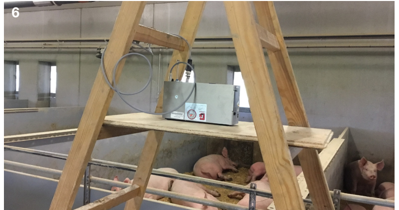
6 Die Messungen in den Buchten zeigten, wie der Staubgehalt durch die testweise eingesetzten Verfahren gesenkt werden konnte.

Stäube üben in der Tierhaltung einen wesentlichen Einfluss auf die Gesundheit der Lebewesen, aber auch das Betreuungspersonal und über die Immissionen auf die Umwelt aus. Egal ob biologisch oder konventionell – bei jeder Form der Nutztierhaltung mit Fokus auf mehr Tierwohl mittels eingestreuter Flächen muss man sich eingehend Gedanken über das Aufkommen von Staub im Tierbereich machen. Auf dem Markt sind vielfältige Produkte mit unterschiedlichen Wirkungsweisen erhältlich. Der Kauf geprüfter Produkte vom einschlägigen Fachhandel mit nachgewiesener Leistungsfähigkeit ist empfehlenswert. ■