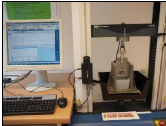
Foto 4: Fleischfarbe messen, Vorbereitung zur Analyse, Scherkraftmessung