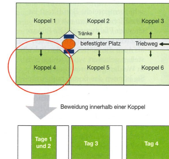
Abb. 1: Intensives viertägiges Koppelweidesystem mit gezielter Portionierung innerhalb der Koppel mit Milchkühen

pelbereiche hinein. Damit wird die höchste Futterausnutzung erreicht und das Gras zur Blätter- und nicht zur Stängelbildung angeregt.