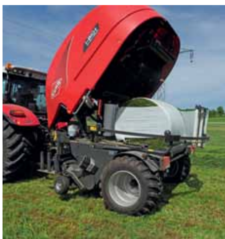
Rundballen sind teuer, daher sollten die verwendeten Mantel- und Stretchfolien von guter Qualität sein.

ponenten, umso dünner kann die Folie hergestellt werden. Allerdings hat Qualität auch ihren Preis, daher sind dünne Silofolien mit hoher Qualität meist teurer als Standardfolien. Viele international durchgeführte Folienvergleiche zeigen, dass Barrierefolien die Silagequalität an der geringer verdichteten Silooberfläche (bis max. 50 cm Tiefe) positiv beeinflussen. Das heißt, dass dort weniger Gärungsverluste und eine bessere Silagestabilität nach der Öffnung des Silos festgestellt werden konnten.