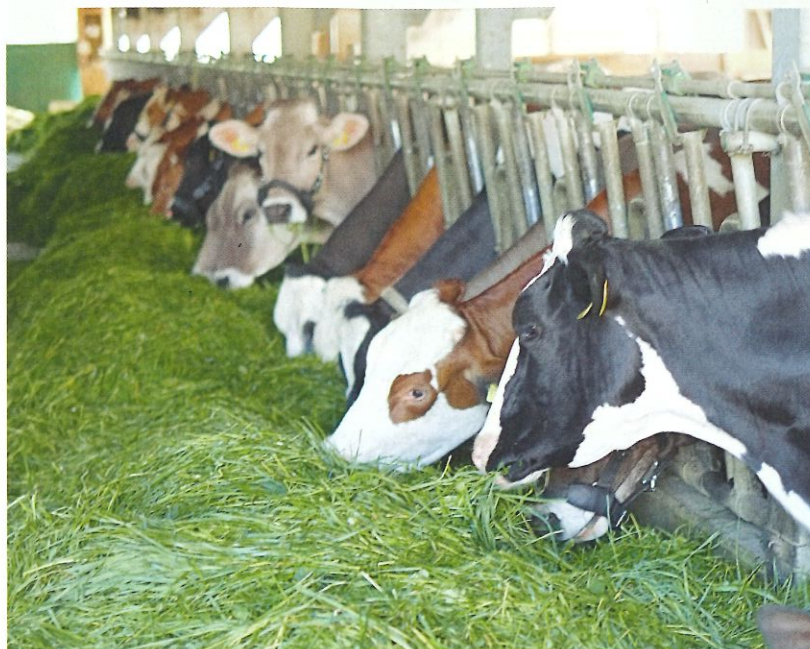
Im Stall fressen die Kühe das Grünfütter schneller und größere Mengen als auf der Weide.

In der Tabelle werden Empfehlungen zur praktischen Rationsgestaltung bei unterschiedlicher Rationszusammensetzung gegeben. Dabei wird auf typische Grünfütterrationen mit Grassilage-, Heu-, Weide- oder Maissilage-Ergänzung bei guter Grundfütterqualität eingegangen. Eine bedarfsgerechte Versorgung mit Mineralfütter ist zusätzlich erforderlich. Die