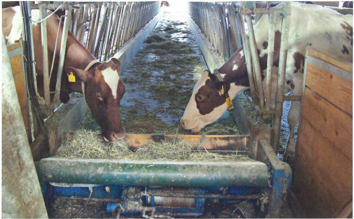
Ein Futterband mit doppelseitiger Fressachse erspart viel Arbeit und Platz für einen Futtertisch im Stall.