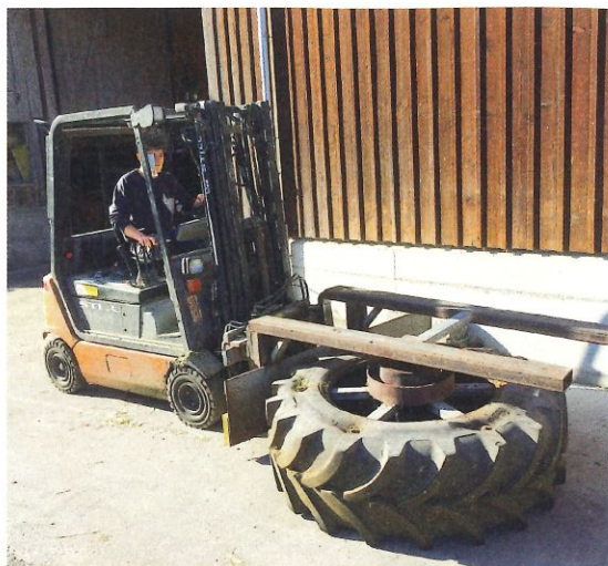
Einfache Futterschieber bringen große zeitliche und körperliche Entlastung.