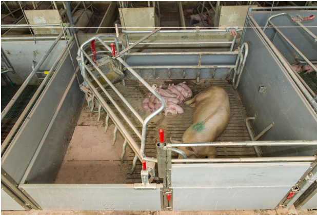
Abbildung 3: Trapezbucht geöffnet