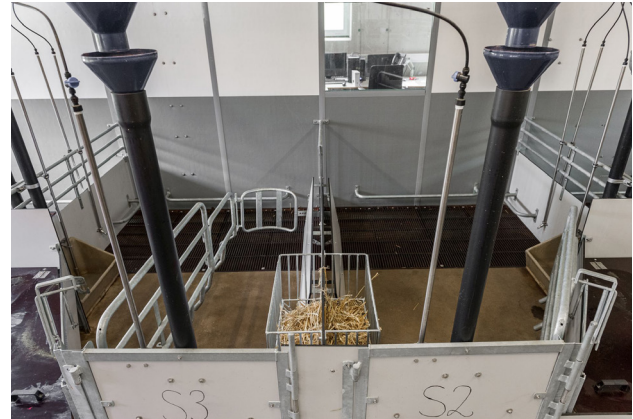
Abbildung 4: SWAP-Bucht links geschlossen, rechts geöffnet (© Pro-SAU)

Abferkeldurchgängen in den sechs Praxisbetrieben gingen 1319 Versuchswürfe, welche den zuvor festgelegten Versuchs-kriterien entsprachen, in die statistischen Berechnungen zu Produktionsleistungen und Wirtschaftlichkeit ein.