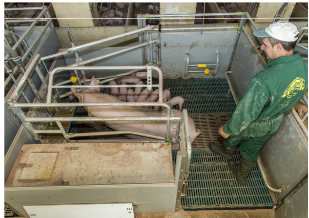
Abbildung 2: Knickbucht mit Betreuer