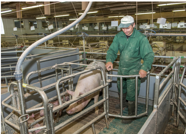
Abbildung 1: Flügelbucht wird vom Betreuer geöffnet