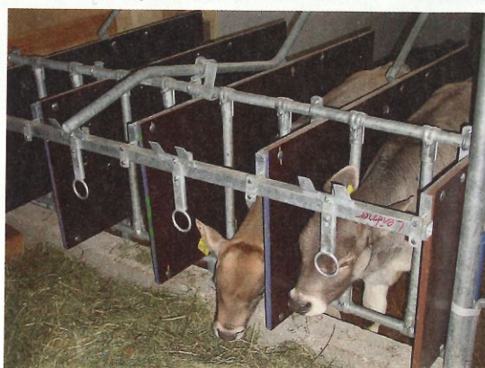
Bieten Sie den Kälbern nach der Tränke Ergänzungsfutter an. Achten Sie darauf, dass sie ungestört fressen können.