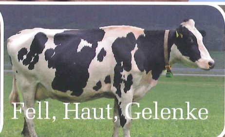
Fell, Haut, Gelenke