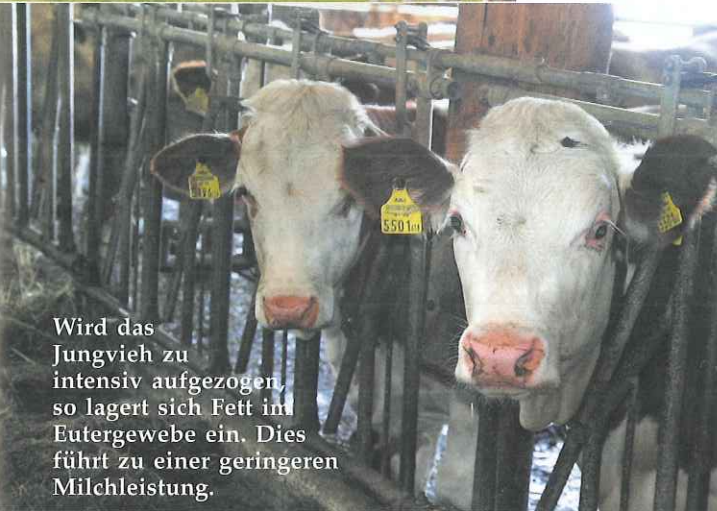
Wird das Jungvieh zu intensiv aufgezogen, so lagert sich Fett im Eutergewebe ein. Dies führt zu einer geringeren Milchleistung.