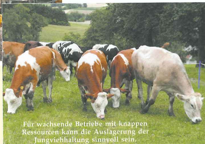
Für wachsende Betriebe mit knappen Ressourcen kann die Auslagerung der Jungviehhaltung sinnvoll sein.

■ 2 Monate vor der Abkalbung: Der Energiebedarf für das Wachstum des ungeborenen Kalbes sowie des Euters nimmt stark zu, zusätzlich geht die Futteraufnahme zurück. Daher muss die Energiekonzentration steigen, um das Tier bedarfsgerecht zu versorgen. Eine zeitgerechte Umstellung ist – vor allem bei Alpfungs- und Weidetieren – notwendig. Ein Wechsel zwischen intensiven und extensiven Phasen kann sich durchaus positiv auf die Milch- bzw. Lebensleistung auswirken. Allerdings müssen an lange Unterversorgungsphasen auch wieder Phasen mit guter Nährstoffversorgung anschließen. Rund drei Monate vor bis zur Belegung dürfen die Tiere jedoch nicht unterversorgt werden, da sich sonst die Fruchtbarkeitsergebnisse verschlechtern. Weide- und Almhaltung wirkt sich daher sehr positiv auf die Entwicklung der Tiere aus.