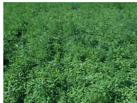
Abbildung 1(links) und 2 (rechts): linkes Foto: gelungene Klee grasuntersaat in Lambach 2005; rechtes Foto: Mais ohne Hacke mit massiver Verunkrautung am Moarhof 2005