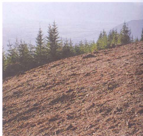
Saatbettvorbereitung nach einer Rodung mit nachfolgender Einsaat.

mit fallweisem Weidegang vorgesehen, so wird die Mischung „D“ mit etwa 26 kg/ha zur Anwendung kommen. Ist in dieser Höhenstufe ausschließlich eine Weide geplant, so soll die Mischung „H“, ebenfalls mit 26 kg/ha, eingesät werden.