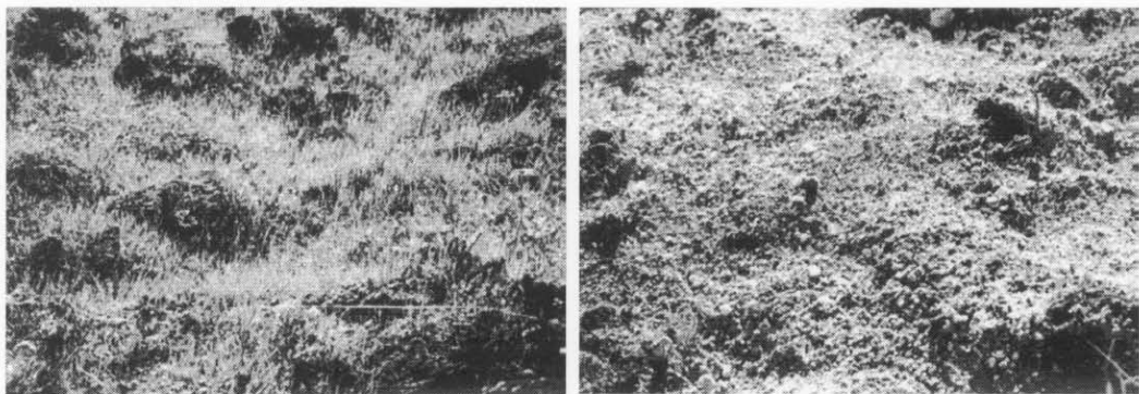
Foto 1 e 2: Le specie foraggere di pianura contenute nei miscugli convenzionali (sinistra) sono più rapide di quelle idonee al sito (destra) nella fase di germinazione ed affermazione. Sito sperimentale di Sudelfeld, due settimane dopo l'esecuzione dell'idrosemina.

Picture 1 and 2: The forage species included in the conventional seed mixture (left) have a faster germination and establishment than the site-specific species (right). Experimental site at Sudelfeld, two weeks after seeding.