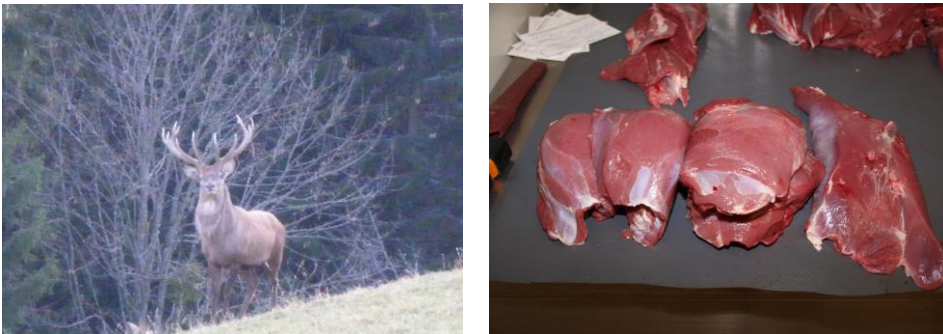
Abbildung 3: Hirsch in freier Wildbahn und entnommene Proben aus der Unterschale

An der HBLFA Raumberg-Gumpenstein wurden die Fleischqualitätsparameter Farbe, Tropf-, Koch- und Grillsaftverlust, Zartheit, Fett- und Eiweißgehalt sowie Fettsäuremuster erhoben und eine sensorische Verkostung durchgeführt. Die Schwermetall-, sowie die Mengen- und Spurenelement-Untersuchungen wurden an der Karl-Franzens-Universität in Graz (Institut für Chemie – Analytische Chemie) durchgeführt.