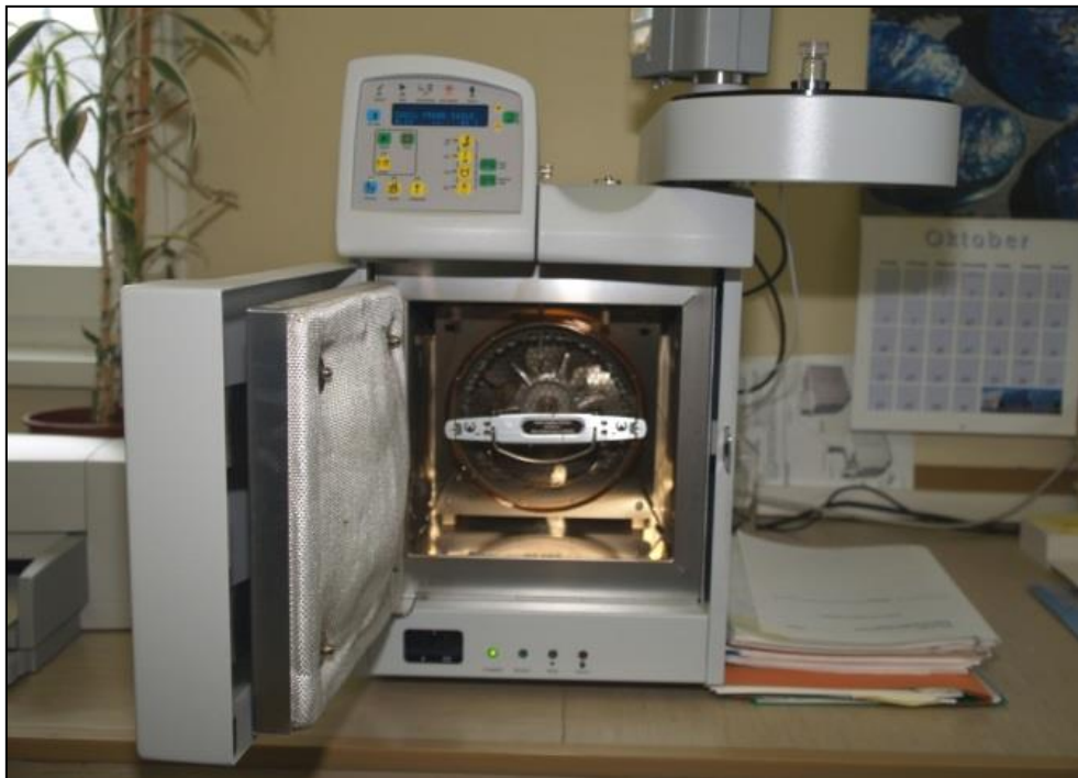
Abbildung 4: Gaschromatograph zur Bestimmung des Fettsäuremusters

Eine Liste mit den analysierten Mengen- und Spurelementen sowie Schwermetallen ist in Tabelle 3 dargestellt. Die Analyse erfolgte nach der in ERTL et al. (2016) beschriebenen Methode.