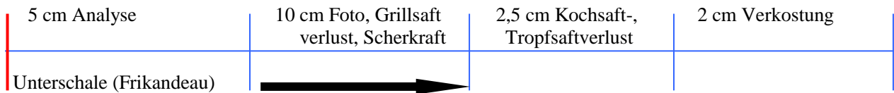
Abbildung 2: Probenschema

An der HBLFA Raumberg-Gumpenstein wurden die Fleischqualitätsparameter Farbe, Tropf-, Koch- und Grillsaftverlust, Zartheit, Fett- und Eiweißgehalt sowie Fettsäuremuster erhoben und eine sensorische Verkostung durchgeführt. Die Schwermetall-, sowie die Mengen- und Spurenelement-Untersuchungen wurden an der Karl-Franzens-Universität in Graz (Institut für Chemie – Analytische Chemie) durchgeführt.