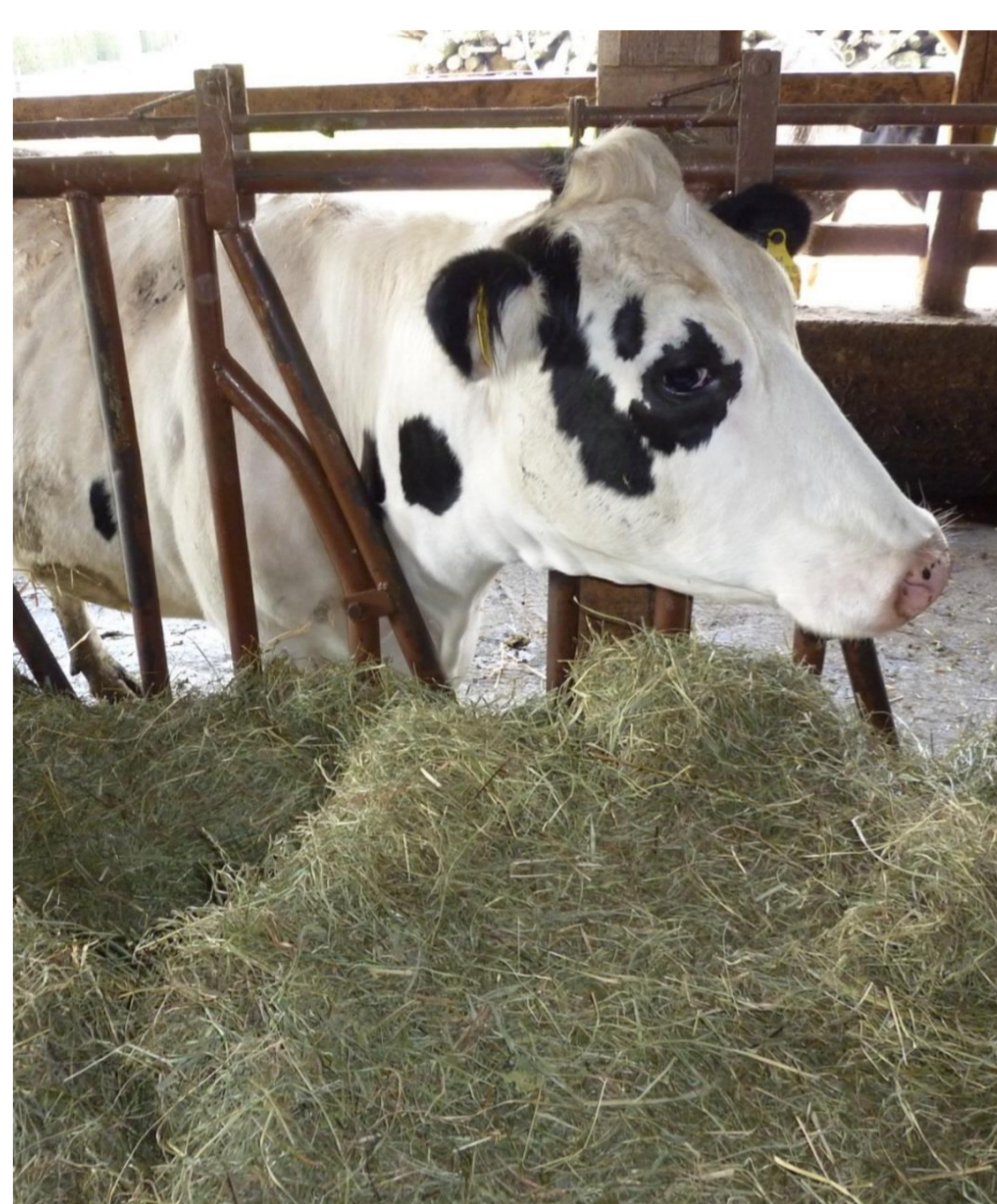
Weidedauer und Rationsgestaltung zu Weidebeginn

Die Ergebnisse weisen auf die Wichtigkeit einer schonenden Weideübergangsfütterung von zumindest 4 Wochen und einer begrenzten Kraftgabe hin!