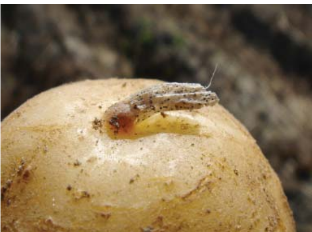
Abbildung 3: „Mausschwänzchen“ mit Mikrosklerotien von C. coccodes

Die Infektion der Kartoffelpflanze kann über die im Boden befindlichen Mikrosklerotien oder die Mutterknolle erfolgen. Bei Feldbegehungen in den Kartoffelanbaugebieten des Wein-, Wald- und Mühlviertels, des Marchfelds, des Eferdinger Beckens und der Steiermark waren überall zahlreich Mikrosklerotien auf Kartoffelstroh nachweisbar, sodass davon ausgegangen werden kann, dass im gesamten