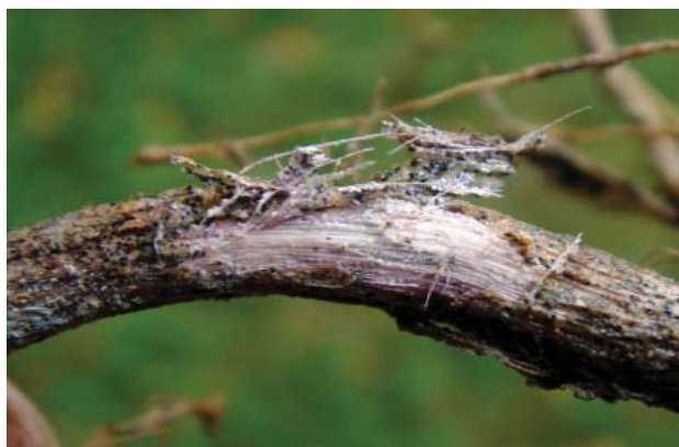
Abbildung 1: Faserige Rindenschicht eines Ausläufers mit den Mikrosklerotien von Colletotrichum coccodes

Erstes Zeichen einer Colletotrichum-Welke kann eine Blattvergilbung sein, auf die relativ rasch Welke-Symptome der ganzen Kartoffelpflanze folgen können. Gräbt man die Pflanzen aus, so ist eine Schädigung der Wurzeln, Stolonen (= unterirdische Ausläufer) und der unterirdischen Achsenanteile durch eine trockene Vermorschung des Gewebes zu erkennen, wobei C. coccodes durch die zwischen dem Rindengewebe und dem Zentralzylinder zahlreich gebildeten Mikrosklerotien deutliche Spuren hinterlässt (Abb. 1). Diese sind auch mit freiem Auge ohne weiteres als kleine schwarze Punkte zu erkennen. Durch den Pilzbefall löst sich das Rindengewebe vom Zentralzylinder und ist deshalb leicht von diesem zu entfernen. Bei stark befallenen Stolonen wird die Nährstoffversorgung der Knollen