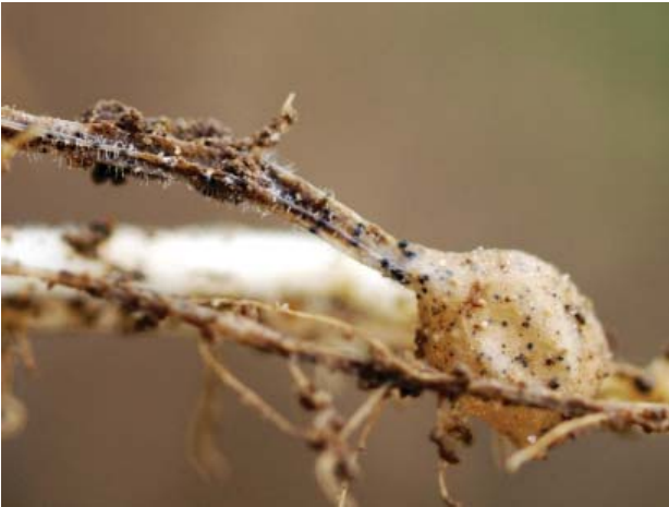
Abbildung 2: Der Colletotrichum -Befall des Ausläufers bewirkt eine Unterversorgung der Knolle mit Wasser und Nährstoffen

spp. ) verursacht werden. In diesem Fall sind die Stängel an der Basis schwarzbraun bis blauschwarz verfärbt und werden als Schwarzbeinigkeit bezeichnet. Eine sichere Diagnose ist durch Ausgraben der Pflanzen möglich, da nur C. coccodes an den vermorschten unterirdischen Pflanzenteilen die charakteristischen Mikrosklerotien hinterlässt.