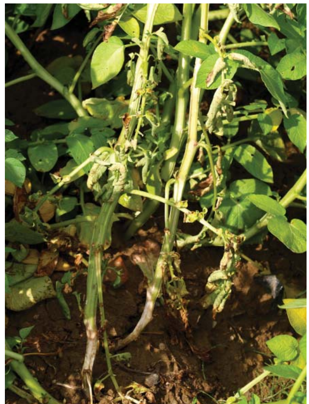
Abbildung 4: Hellweiße Stängelbasis durch Befall mit Sclerotinia sclerotiorum

Der Becherpilz Sclerotinia sclerotiorum ist in Österreich vor allem als Verursacher einer Weißstängeligkeit bei Raps, Sonnenblume und Sojabohne bekannt. Begünstigt durch die Feuchtperioden der letzten Jahre ist er auch bei der Kartoffel als Verursacher einer Stängelfäule in Erscheinung getreten. An den unteren Stängelteilen und den Blattachseln führt er zu braunen, eingesunkenen Flecken, die von einem