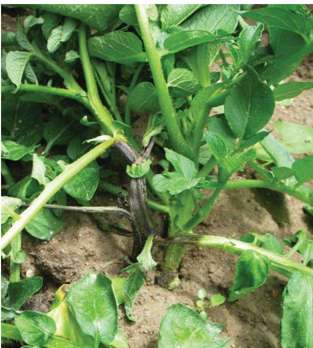
Abbildung 5: Schwarzbeinigkei der Kartoffel

Die Schwarzbeinigkei ist eine von Bakterien im Inneren der Stängelbasis verursachte Fäulniskrankheit. Sie führt zu einer Schwarzverfärbung des Pflanzengewebes (Abb. 5), der Stängel wird weich und stinkend. Durch Unterbrechung der Wasserzufuhr welken die Pflanzen und sterben schließlich ab. Als Verursacher der Schwarzbeinigkei wurden in Österreich bisher die beiden Bakterienarten Pectobacterium carotovorum und P. atrosepticum nachgewiesen (SÖLLINGER UND HUSS 2013). Auf den Knollen verursachen sie die klassische Nassfäule. Fehlstellen bzw. reduzierter Feldaufgang sind häufig auf diese Bakterien zurückzuführen, wenn es bereits kurz nach dem Legen zu einer nassfaulen Degeneration der Mutterknolle kommt.