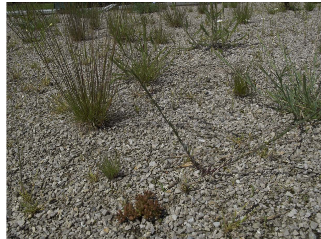
Detailaufnahme der „Dachbegrünungsmischung LFZ Schönbrunn“, am LFZ Raumberg-Gumpenstein, Mai 2013

Projektnummer: 100807 Laufzeit des Projektes: 2011 - 2014