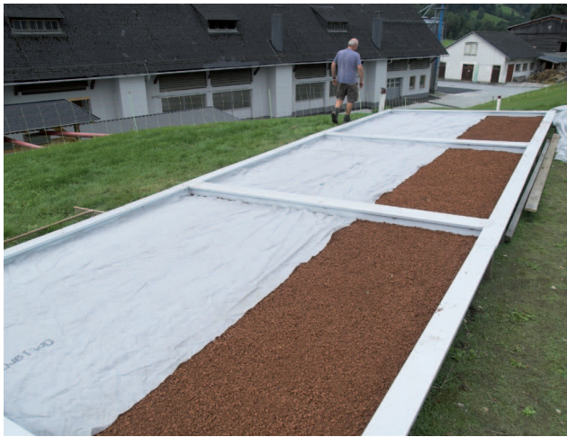
Aufbringen des Zielsplitts und Filtervliesabdeckung auf der Versuchsanlage des LFZ Raumberg-Gumpenstein, September 2011

Im Zusammenhang mit Flächenverbrauch und Bodenversiegelung und dem damit verbundenem Verlust an naturnahen Lebensräumen rückt das Extensiv-Dach als einer der möglichen Ersatzlebensräume auch im ländlichen Bereich ins Blickfeld.