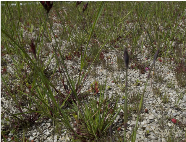
Detailaufnahme der „Inneralpinen Dachbegrünungsmischung“ am LFZ Raumberg-Gumpenstein, Mai 2013

Die „Inneralpine Dachbegrünungsmischung“ konnte sich durch die Frühjahrsanlage besser entwickeln und weist bereits im Jahr nach der Ansaat blühende, fruchtende Gräser und Kräuter mit hohem ästhetischen und