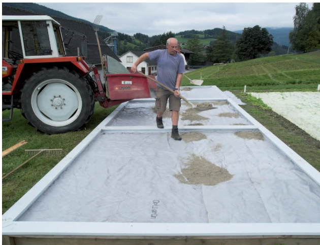
Aufbringen der Vegetationstragschicht auf dem Filtervlies, LFZ Raumberg-Gumpenstein, September 2011

Derzeit erfolgt die Begrünung von Extensiv-Dächern mit einem Gemisch von Sedumsprossen und Kräutern aus unterschiedlichen Herkünften auf standardisierten Substraten aus Vulkantuff, Ziegelsplitt und ähnlichem.