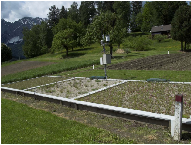
Ansicht der drei Varianten des Dachbegrünungsversuches am LFZ Raumberg-Gumpenstein, Mai 2013

Im Jahr 2013 zeigten sowohl die Variante „Dachbegrünungsmischung LFZ Schönbrunn“ als auch die Variante „Inneralpine Dachbegrünungsmischung“ eine zufriedenstellende Vegetationsdeckung. Auf den Versuchsflächen konnten sich neben den eingesäten Sedumarten auch die Gräser und Kräuter etablieren.