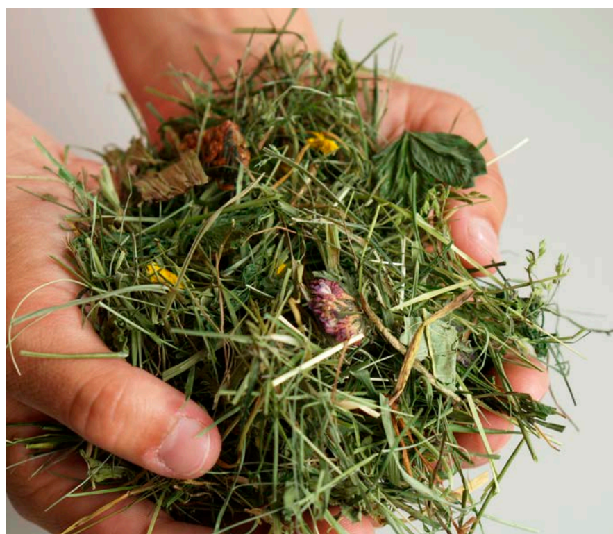
Belüftungsheu bewahrt mehr wertvolle Blattanteile als Heu aus Bodentrocknung.

Scannen Sie dazu den QR-Code oder gehen Sie auf www.raumberg-gumpenstein.at/podcast