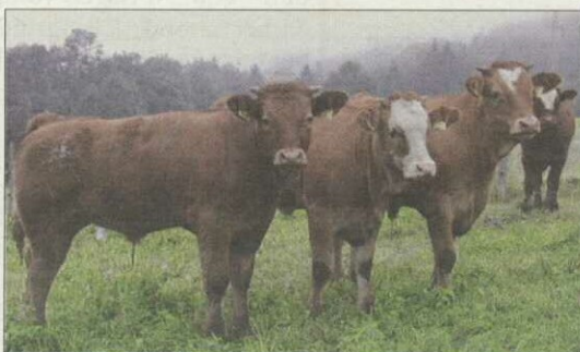
Mutterkuhbetriebe benötigen ausreichend geeignete Weideflächen.

• In den ersten zwei bis vier Wochen nach der Abkalbung sollten die Mutterkühe etwas verhalten gefüttert werden, da ansonsten die Milchleistung sehr rasch und stark ansteigt. Bei hoher Energieversorgung besteht die Gefahr von Durch-