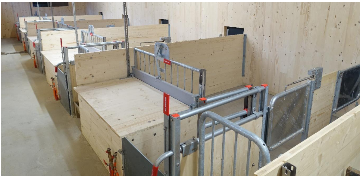
Abbildung 2: Innere Buchtenstruktur mit Ferkelnestern im Modularen Abferkelstall

Stallhülle und Buchtenelemente der Bio-Abferkelstallung wurden im Zuge des Projektes MODAB (2016-2017) geplant und errichtet. Alle Informationen zur Entstehung können unter folgender Adresse abgerufen werden: https://nature-line.com/fileadmin/user_upload/Abferkeln/WelCon/Modullstallbau_fu_r_Bioschweine_ANSICHT.PDF . Die zu den insgesamt sieben Abferkelbuchten gehörigen Ferkelnester haben jeweils eine Höhe von 0,6 m, eine Länge von 1,4 m und eine Breite von 0,8 m. Daraus ergibt sich eine Bodenfläche von jeweils 1,12 m 2 . Sämtliche Berechnungen und Messungen im Zuge des Projektes WAMI beziehen sich auf die Beheizung dieser sieben Ferkelnester. Wie im oben angeführten Artikel beschrieben können als Baukostenrichtwert pro Abferkelbucht etwa 9 000 € kalkuliert werden.