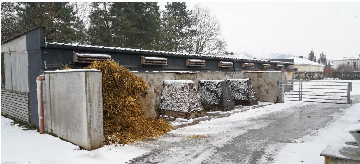
Abbildung 1: Im Jahr 2016 erbauter Modularer Abferkelstall mit integriertem Mistreaktor zur Beheizung der Ferkelnester.

When solid manure is stored, the manure pile heats up itself. Due to microbiological activity (thermophilic bacteria), the temperature inside the manure pile rises up to around 70° C. The aim of the project was the controlled use of the heat from this hot rotting phase. For this purpose, concrete blocks were used as heat exchanger elements, which are equipped with heating pipes. By heating the concrete body, the water in the heating pipes is heated, which leads to the heating of a water reservoir. After determining the maximum possible heat yield, the further utilisation of this heat were discussed. Since the manure heating system corresponds to a low-energy system (approx. 30°C continuous heat supply), the installation of a brine/water heat pump to increase the heat supplied or a speed-controlled pump to reduce the flow-rate of the carrier medium could make sense. In 2016, the MODAB project was implemented to design and construct optimized outer shell and pen design for organic farrowing accommodation. Additionally, structures to generate thermal energy out of the farmyard manures waste heat were designed. The overall objective of this scientific activity was to find out to what extent the heat released during rotting of farmyard manure can be used to run the heating of piglet nests. The results show, that at least 10 % of the necessary thermal energy can be obtained from the farmyard manure.