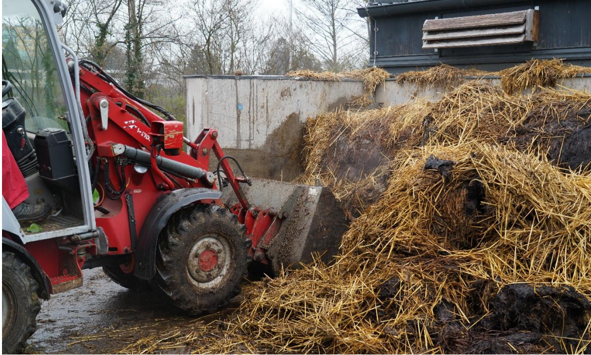
Abbildung 6: Komplette Entladung des Mistreaktors nach vollendetem Energiegewinnungsdurchlauf.

täglichen Mistmenge von etwa 1000 kg und täglichem Entmistungsintervall (Bezugsbasis 45 Muttersauen) pro Tag mindestens eine Stunde Arbeitszeit kalkuliert werden. Für die komplette Entladung des Mistreaktors nach einem vollständigen Energiegewinnungsdurchlauf während dem die einzelnen Reaktorblöcke nicht abgeräumt werden, ist mit einem Arbeitsaufwand von etwa drei Stunden zu rechnen.