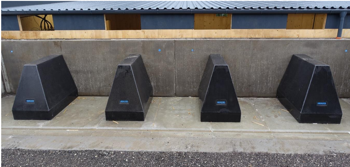
Abbildung 3: Reaktorblöcke aus Beton

Um die Hitze aus dem Mist nutzbar zu machen, braucht es entsprechende Infrastruktur, ein Leitungssystem mit Pumpe, sowie ein entsprechendes Leit- und Speichermedium. Bei der Planung des Leitungssystems war zu beachten, dass nicht nur dessen absolute Effizienz, sondern auch die praktische Umsetzbarkeit des Be- und Entladens eine wichtige Rolle spielt. Wird zum Beispiel die Leitung ohne weitere Verbauungselemente unter einem Misthaufen platziert, wäre die Wärmeeffizienz aufgrund des engen Kontaktes zwischen Misthaufen und Leitmedium hoch. Ein solches System ist aber praktisch kaum sinnvoll da es an der für Be- und Entladung notwendigen Stabilität mangelt. Um das System also auch arbeitswirtschaftlich nutzbar zu machen, wurden stabile Mistreaktormodule geplant und umgesetzt. Als Leitmedium wurde Wasser verwendet.