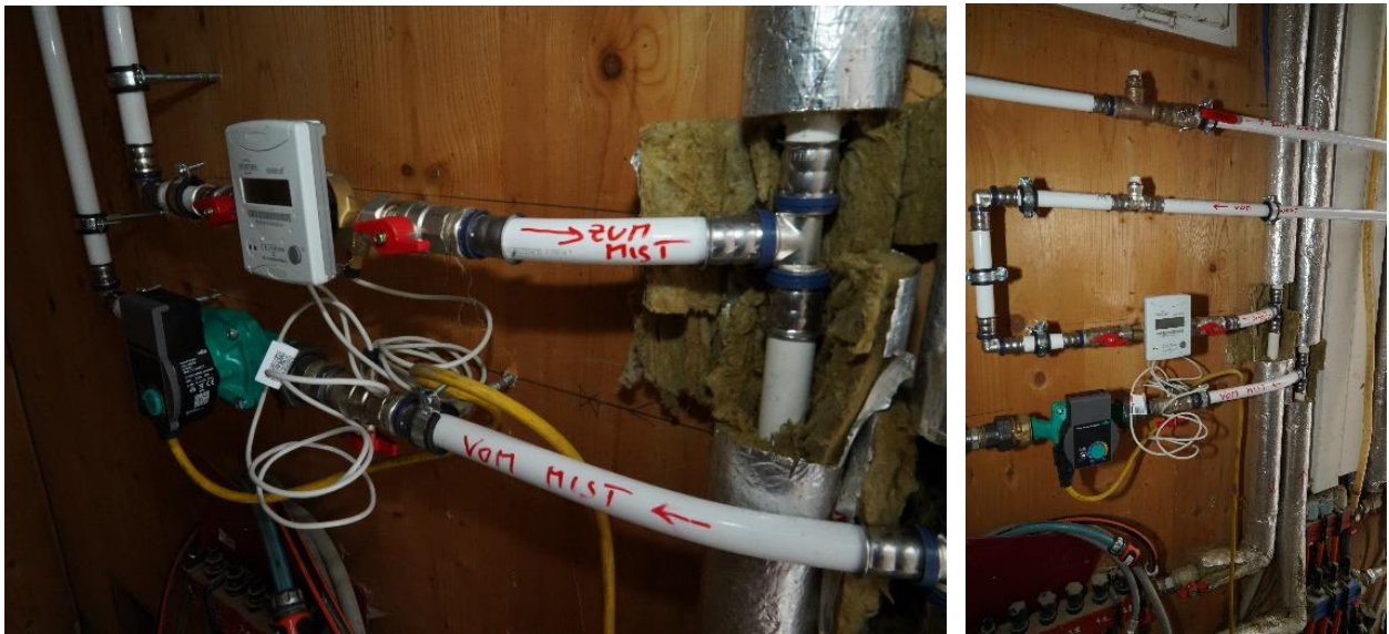
Abbildung 4: Wasserleitungen von bzw. zu Mistreaktor und Ferkelnest.