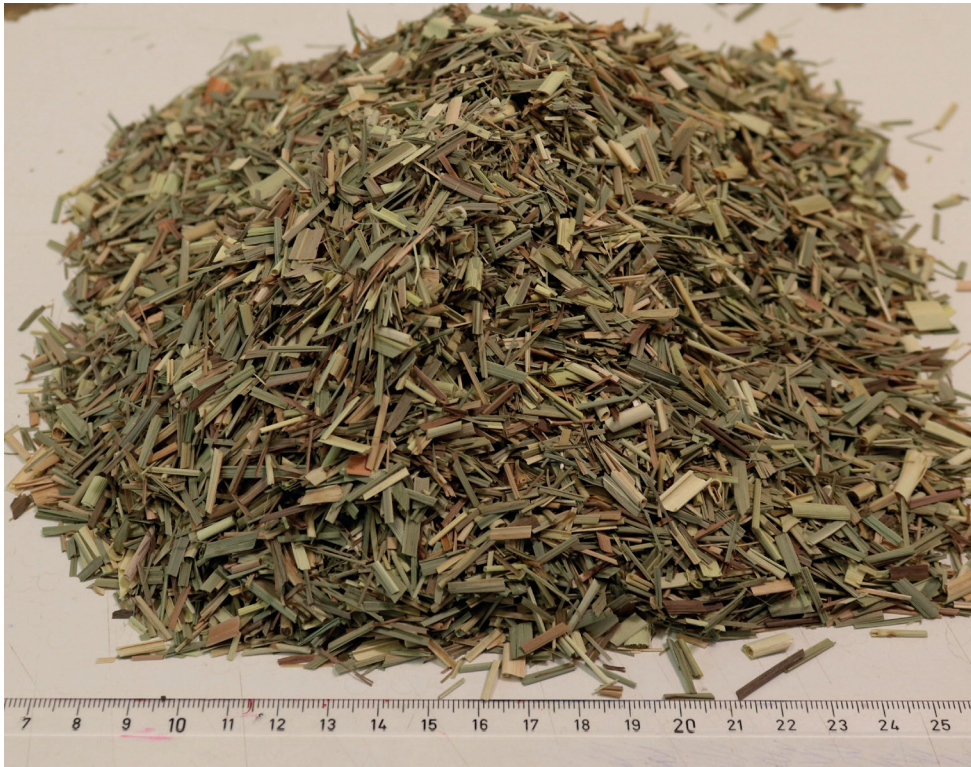
Abbildung 1: Zitronengras, das im Maststier-Versuch eingesetzt wurde

Scharzau am Steinfeld (Niederösterreich) durchgeführt und umfasste 48 Maststiere. Die Maststiere (vorwiegend Fleckvieh) waren zu Beginn des Versuchs zwischen 235 und 395 Tage alt. Die Messungen fanden im Herbst 2020 statt und erstreckten sich über einen Zeitraum von 84 Tagen.