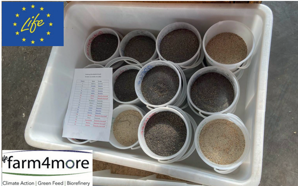
Abbildung 3: Für die Fütterung vorbereitetes Versuchsfutter

Für den Versuch wurden 3 Versuchsgruppen mit je 6 Kühen gebildet. Eine Versuchsgruppe erhielt, zusätzlich zu den oben beschriebenen Futtermitteln, 2 kg Energiekraftfutter pro Kuh und Tag (34 % Gerste, 36 % Körnermais, je 11 % Weizen und Trockenschnitzel, 7 % Weizenkleie, 1 % Rapsöl). Bei den beiden weiteren Versuchsgruppen wurde in dieses Energiekraftfutter noch 200 g Biokohle pro Kuh und Tag bzw. 200 g Biokohle und 90 g Futterharnstoff pro Kuh und Tag eingemischt. Die Fütterung des Versuchsfutters erfolgte in zwei Teilgaben pro Tag (zur Morgen- und Abendfütterung).