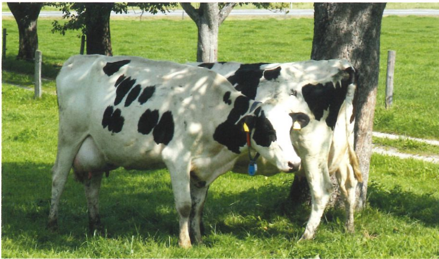
Egal ob Bäume, Schutzhütten oder Sonnensegel, die Kühe brauchen auf der Weide eine Möglichkeit, um sich vor der Sonne zu schützen.

Weidehaltung scheint in der Theorie recht einfach, doch in der Praxis lauern die unterschiedlichsten Stolpersteine. Wenn man ein paar grundlegende Dinge beachtet, spart man Arbeitszeit, stärkt Klauen- und Eutergesundheit und schont Weideflächen. Worauf es zu achten gilt.