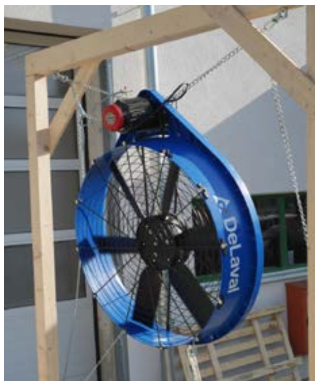
Abbildung 1: Ventilator im Messstand

Das Rind hat aufgrund seiner ruminalen Verdauung eine sehr hohe Eigenwärmeproduktion. Zusätzlich wirkt im Sommer die Sonne auf den Milchviehstall ein, so dass sich im Stallinneren die Umgebungstemperatur durch die Wärmestrahlung erhöht. Steigen die Temperaturen im Stall, leiden die Tiere unter Stress, da sie ihre produzierte Wärme nicht mehr im ausreichenden Maße an die Umgebung abgeben können. Doch nicht nur die Temperatur ist ausschlaggebend für Hitzestress – weitere beeinflussende Faktoren sind Sonneneinstrahlung, Leistung der Tiere, aber auch die Luftfeuchtigkeit. Je höher die Temperatur, desto niedriger sollte die Luftfeuchtigkeit sein (siehe Temperatur-Humiditätsindex, kurz „THI“). Ab einer Umgebungstemperatur von 21 °C und einer rel. Luftfeuchte von 70 % beginnt für Milchkühe die körperliche Belastung in einem Maße anzusteigen, dass man von Hitzestress spricht.