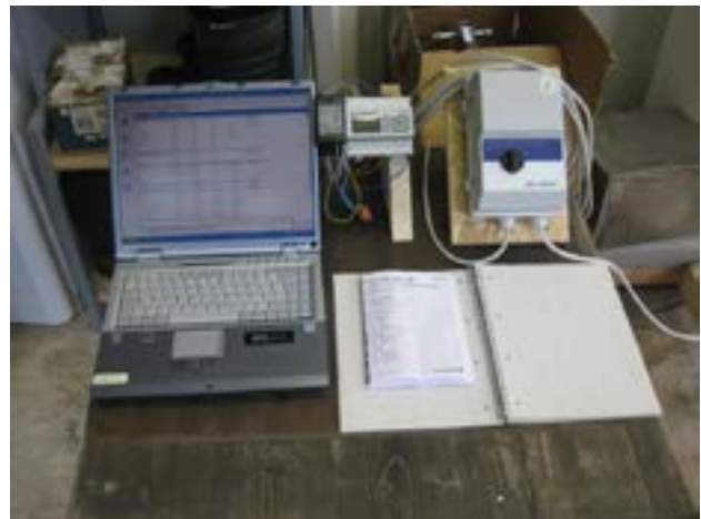
Abbildung 4: Steuerung Ziehl-Abegg FF 091

Alle der verwendeten Ventilatoren sind in der Lage, Windströmungen bis 2 m/s und mehr zu erzeugen und somit für einen Einsatz als Kühlsystem in Rinderställen geeignet. Erwartungsgemäß erzeugen größere Ventilatoren unter