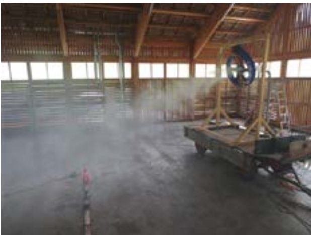
Abbildung 3: Messstand der HBLFA Raumberg-Gumpenstein

Verbrauch ermittelt. Die Ergebnisse geben Auskunft über den Energieverbrauch pro Stunde, wobei hier nur Werte der drei höchsten Leistungsstufen ermittelt wurden.