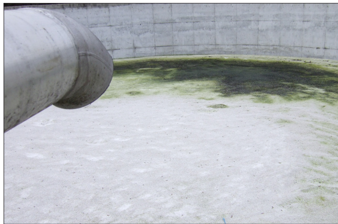
Leichtgutschüttungen sind kostengünstig, allerdings nur für Gülleoberflächen ohne natürliche Schwimmdeckenbildung.