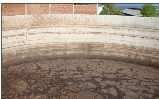
Bis zu 80 Prozent Emissionsreduktion erreicht man bei Gülle mit natürlicher Schwimmdecke. Um sie nicht zu zerstören, sollte die Einleitung des Wirtschaftsdüngers unterhalb des Güllespiegels erfolgen.