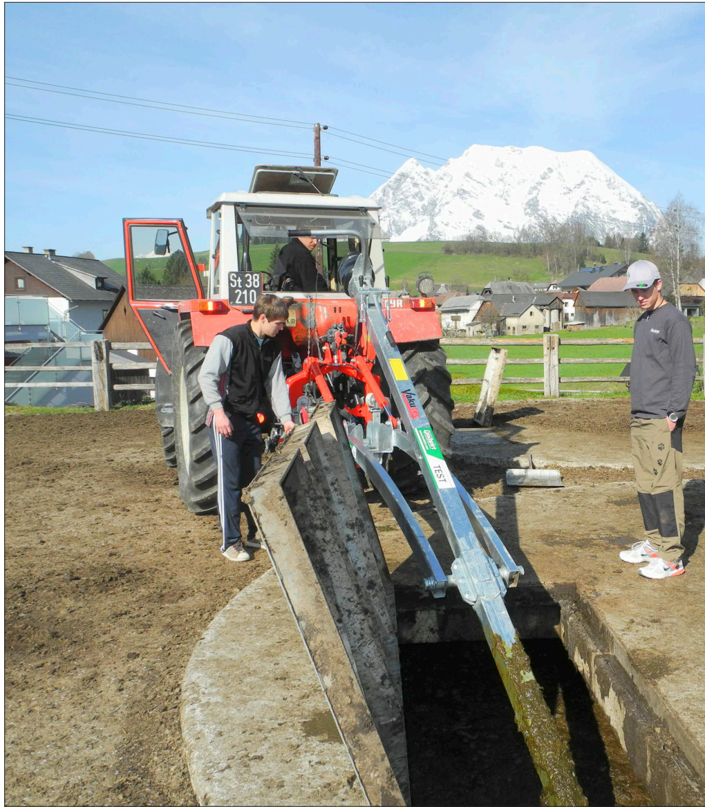
Geschlossene Gruben mit Betondeckel sind bei kleineren Durchmesser einfach zu realisieren und können einen Zusatznutzen bieten (im Bild als Auslaufläche). Grundsätzlich verteuern sie allerdings den Grubenraum um rund 30 Prozent.

Bei Rindergülle besteht in der Regel keine Notwendigkeit der Abdeckung, da hier Schwimmdecken entstehen, die jeweils vor dem Ausbringen aufgelöst werden müssen. Nur während des Homogenisierens sind geschlossene Behälter günstiger zu bewerten als natürliche Schwimmdecken. Daher ist die Lagerabdeckung vor allem für Mastschweinegülle und für Gülle ohne natürliche Schwimmdeckenausbildung wichtig. Damit eine natürliche