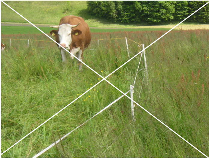
So nicht! Auch bei Portionsweidehaltung wird eine Aufwuchshöhe zwischen 15-20 cm angestrebt