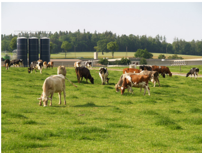
Typisches Bild einer Kurzrasenweide