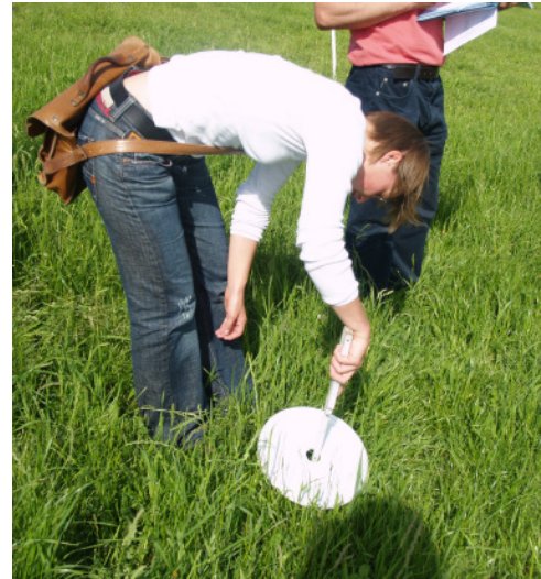
Aufwuchshöhenmessung mit einem gelochten Plastikdeckel und Zollstab am 1. Koppelauftriebstag