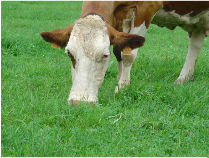
Mit energie- und eiweißreichem Weidefutter kann Kraftfutter gespart werden