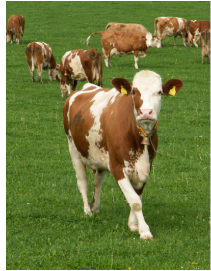
In Gunstlagen setzen Betriebe oft auf Kurzrasenweidehaltung, dabei wird eine gleichbleibende Aufwuchshöhe zwischen 5-7 cm angestrebt