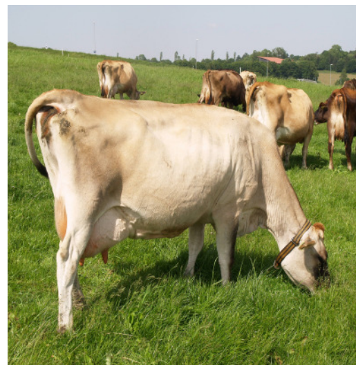
Eine Jersey-Herde auf einer Koppelweide bei einer Weidesaufwuchshöhe von 15-20 cm am 1. Beweidungstag