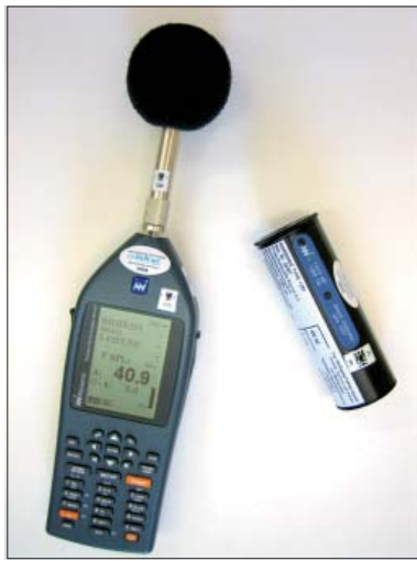
Abbildung 2: Schallanalysator nor140, Firma Norsonic

bei Schallpegelmessungen sogenannte Bewertungsfilter (elektrische Filter im Schallpegelmessgerät) verwendet. Die Frequenzbewertung, die am gebräuchlichsten ist, wird als „A-Bewertung“ bezeichnet. Sie entspricht näherungsweise der Empfindlichkeit des menschlichen Gehörorgans. Messergebnisse die „A-bewertet“ sind, werden mit dB(A) bezeichnet.