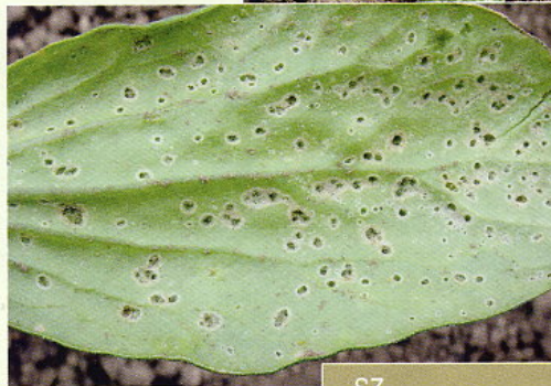
Abb. 5: Fraßspuren des Gartenkugelspringers auf der Unterseite eines Kürbis-Keimblattes