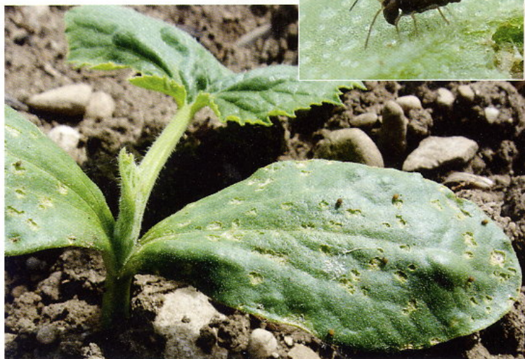
Abb. 1 und 2: Keimpflanze des Steirischen Ölkürbisses mit einigen Gartenkugelspringern und den von ihnen verursachten Fraßspuren. Bourletiella hortensis zeigt den für alle Kugelspringerarten typischen rucksackförmigen Hinterleib

In der australischen Region, wo dieser Kugelspringer ursprünglich nicht heimisch war, ist er ein ernst zu neh-