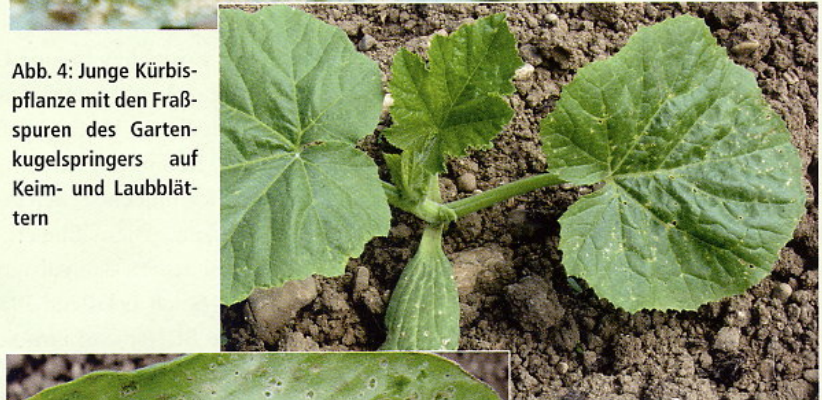
Abb. 4: Junge Kürbispflanze mit den Fraßspuren des Gartenkugelspringers auf Keim- und Laubblättern