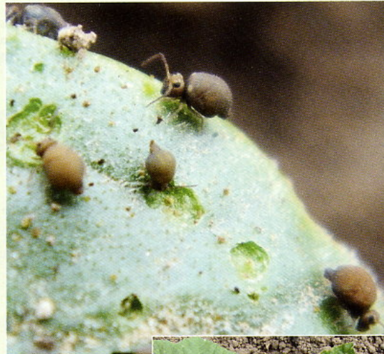
Abb. 3: Auf einem Keimblatt fressende Gartenkugelspringer. Im Hintergrund ein erwachsenes Tier, davor ein helleres Jugendstadium

WINNER, C. & W.R. SCHÄUFELE (1967): Untersuchungen über Schäden an Zuckerrüben durch subterrane Collembolen. Zucker 20: 641–644.