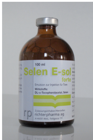
Abb. 5: Selen E-sol®-Arzneimittel – enthält Vitamin E und Selen

Das Injektionspräparat Selen E-Sol® (rechts, Abb. 5) ist ein Arzneimittel, während das über das Maul zu verabreichende Präparat Chevivit E-Selen® (links, Abb. 4)