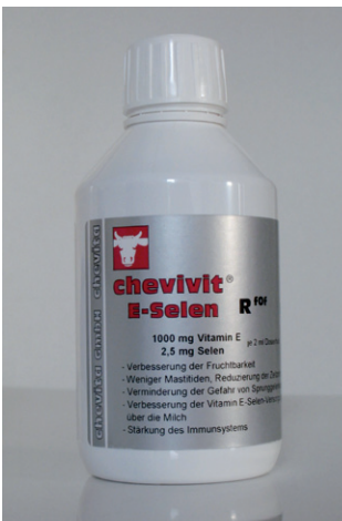
Abb. 4: Chevivit E-Selen® biotaugliches Ergänzungsfuttermittel – enthält Vitamin E und Selen