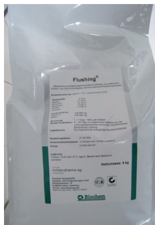
Abb. 6: Flushing – Ergänzungsfuttermittel

zwar ebenfalls Vitamin E und Selen als Wirksubstanzen enthält, aber als bio-taugliches Futtermittel eingestuft ist.