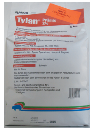
Abb. 7: Tylan – Arzneimittel mit Antibiotika