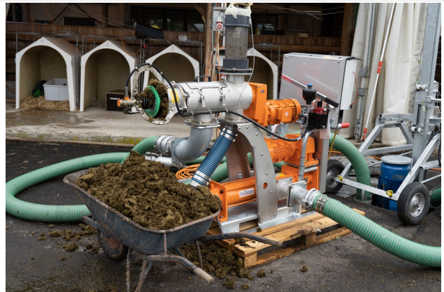
Abbildung 4: Gülleseperator

50 % der ammoniakalisch bedingten N-Verluste können im Schnitt mit dieser Technik eingespart werden, was insbesondere bei den jetzigen Stickstoffpreisen eine besonders hohe Bedeutung bekommen hat. Rund ein Euro pro m 3 mit dem Schleppschuh ausgebrachter Gülle kann auf der Habenseite unter dem Mott „Stickstoffgewinn“ verbucht werden. Zusätzlich gibt es ab 1.1.2023 einen Fördersatz von € 1,40/m 3 für die mit dem Schleppschuh ausgebrachter Gülle für max. 50 m 3 /ha.