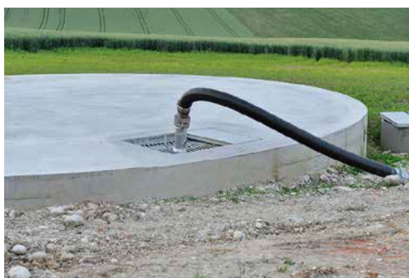
Abbildung 2: Neu errichtete Güllelager sind jedenfalls abzudecken

Die Lager von flüssigen Wirtschaftsdüngern sind in Zukunft nur mehr mit einer festen Abdeckung zu bauen. Offene Güllelager mit einer Schwimmdecke weisen zwar während dem Bestehen einer festen Schwimmdecke einen 80 %igen Emissionsschutz auf, aufgrund der Notwendigkeit des häufigen Homogenisierens während der Vegetationsperiode reduziert sich dieser Wert allerdings auf nur 40 %. Bei Güllen ohne Schwimmdecke kann auch mit Schwimmköpern eine ähnlich hohe Ammoniakabgasung verhindert werden wie mit festen Abdeckungen. Stallmist sollte auf dreiseitig umwandeten Stallmistmieten gelagert werden. Eine Überdachung ist nur bei Hühnerkot erforderlich und bei Hähnchenmist empfehlenswert.