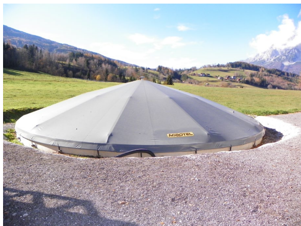
Abbildung 1: Zeltdach Schweinegüllelager Agrotel an der HBLFA Raumberg-Gumpenstein