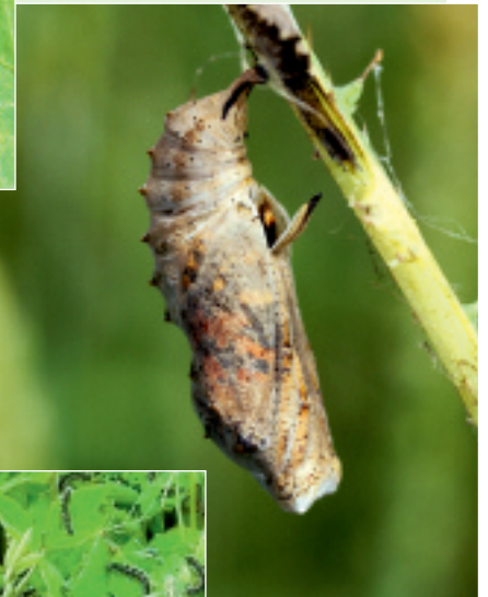
Abb. 5: Auf einer Ackerdistel angehef- tete Stürzpuppe eines Distelfalters. Der Schmetterling befindet sich unmittelbar vor dem Schlüpfen. Lambach, 12. 7. 2009