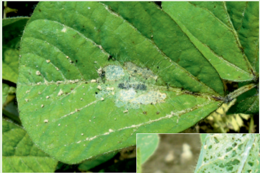
Abb. 2: Jungraupe des Distelfalters auf Soja- bohne unter einem schützenden Gespinst aus Seide. Neukirchen bei Lambach, 9. 6. 2009

Aufsehen erregten die Raupen aber nicht nur durch den auf bestimmten Feldern bis zum Kahlfraß führenden Besall der Sojabohne (Abb. 6). Von verschiedenen Orten, wie Pöttching im Burgenland, Ried in der Riedmark sowie Aistersheim in Oberösterreich