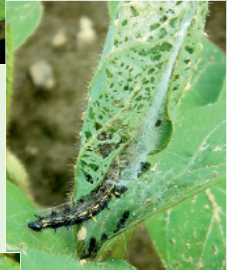
Abb. 3: Raupe des Distelfalters in einem tütenförmig zusammen- gesponnenen Blättchen der Soja- bohne. Neukirchen bei Lambach, 9. 6. 2009