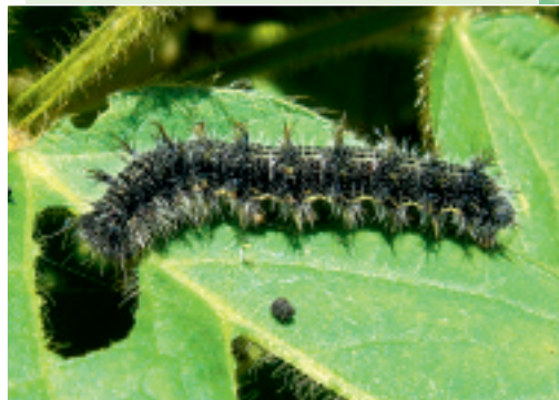
Abb. 4: Erwachsene Distelfalterraupe auf einem Sojablatt. Niederneukirchen, 17. 6. 2009