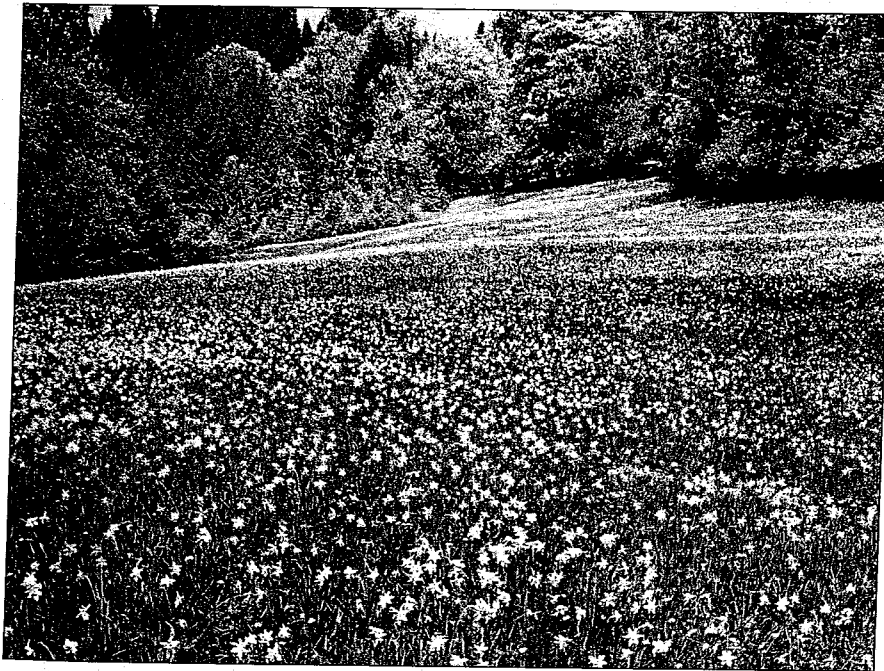
Abb. 1 (links oben): Spiranthes spiralis in der Mähwiese bei Krungl am 19.9.2009, im Hintergrund die Beckenlandschaft von Bad Mitterndorf. Abb. 2 (rechts oben): Gedrehter Blütenstand von Spiranthes spiralis am 19.9.2009 in der Mähwiese bei Krungl. Abb. 3 (unten): Spiranthes spiralis -Wiese bei Krungl im Frühjahrs-Aspekt mit einem Massenvorkommen von Narcissus radiiflorus.