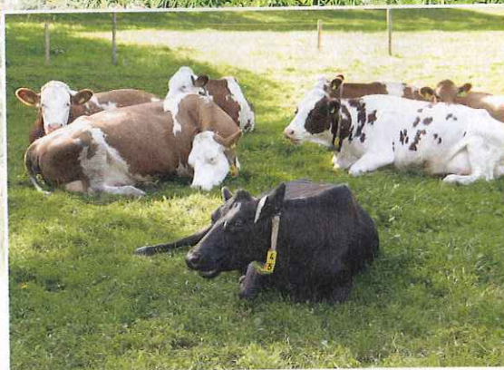
Die Weide spart nicht nur Kraftfutter, sondern bietet den Rindern auch maximalen Liegekomfort.

Die Milchleistung steigt an und auf Proteinkraftfutter kann gänzlich verzichtet werden.