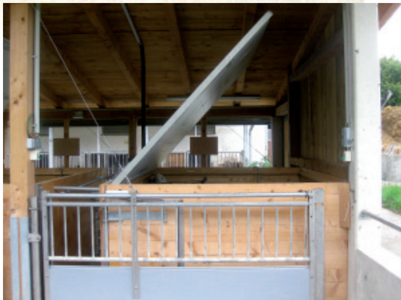
Liegebereich mit geöffnetem Deckel.

Die Arbeiten am Betrieb wurden in tägliche und nicht tägliche Arbeiten ge-