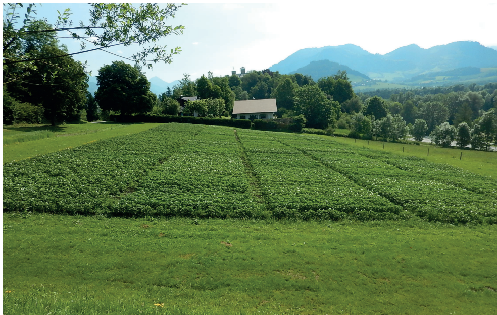
Abbildung 1: Kartoffelversuch in Trautenfels Ende Juni

Die weiteren Pflegearbeiten bestehen aus Häufeln, solange das Kraut noch nicht so stark entwickelt ist, dass es durch die Traktorreifen beim Durchfahren beschädigt wird. Natürlich ist in einem Sortenversuch mit 4 verschiedenen Sorten hintereinander das Häufeln aus dem oben genannten Grund nicht so lange möglich wie bei einer einheitlichen Sorte im Praxisanbau. Auch alle anderen Maßnahmen im Hinblick auf Pflanzenschutzmaßnahmen erfordern dieselben Grundsätze. Je nach Befallsdruck wird ein im Biolandbau erlaubtes Mittel gegen die Larven der Kartoffelkäfer ausgebracht, die verstärkt in Lambach Probleme bereiten, zunehmend aber auch in Trautenfels. Zusätzlich gilt es, eine Infektion