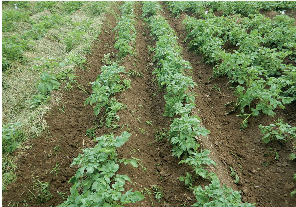
Abbildung 6: Durchfahrt mit der Hacke, daneben ist der Mulchversuch ersichtlich

Aus oben angeführten Gründen wird auch bei der Fruchtfolge an den Standorten Trautenfels und Lambach die Kartoffel gleich nach einem zweijährigem Klee-, bzw. Luzernegras angebaut, erst danach folgt das Wintergetreide. Auf diese Weise wird versucht, den Befall mit Drahtwurm möglichst gering zu halten. Der von KEISER (2007), aber auch von DIERAUER (2015) beschriebene Zusammenhang zwischen Drahtwurmbefall und „dry core“ konnte weder bei Proben von Trautenfels noch Lambach bestätigt werden. Generell erweist sich der Anbau von krautfäule-toleranten oder -resistenten Sorten im Biokartoffelanbau als günstig, wie den Tabellen 1 und 2 zu entnehmen ist.