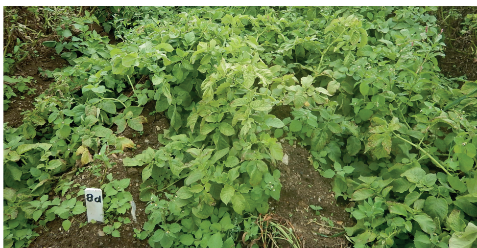
Abbildung 5: Resistente Kartoffelsorte inmitten anfälliger