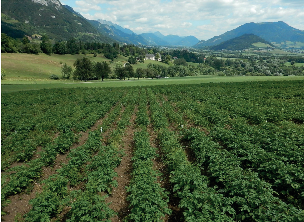
Abbildung 2: Kartoffelversuch in Trautenfels Mitte Juli

durch Krautfäule rechtzeitig mit einem Kupfermittel zu behandeln, was am Standort Trautenfels wahrscheinlicher als in Lambach ist. Eine Behandlung mit einem Kupfermittel erfolgt am Standort Trautenfels jeweils mit dem Schlauch, weil ein Durchfahren mit dem Traktor zu diesem Zeitpunkt mehr Schaden als Nutzen anrichten würde.