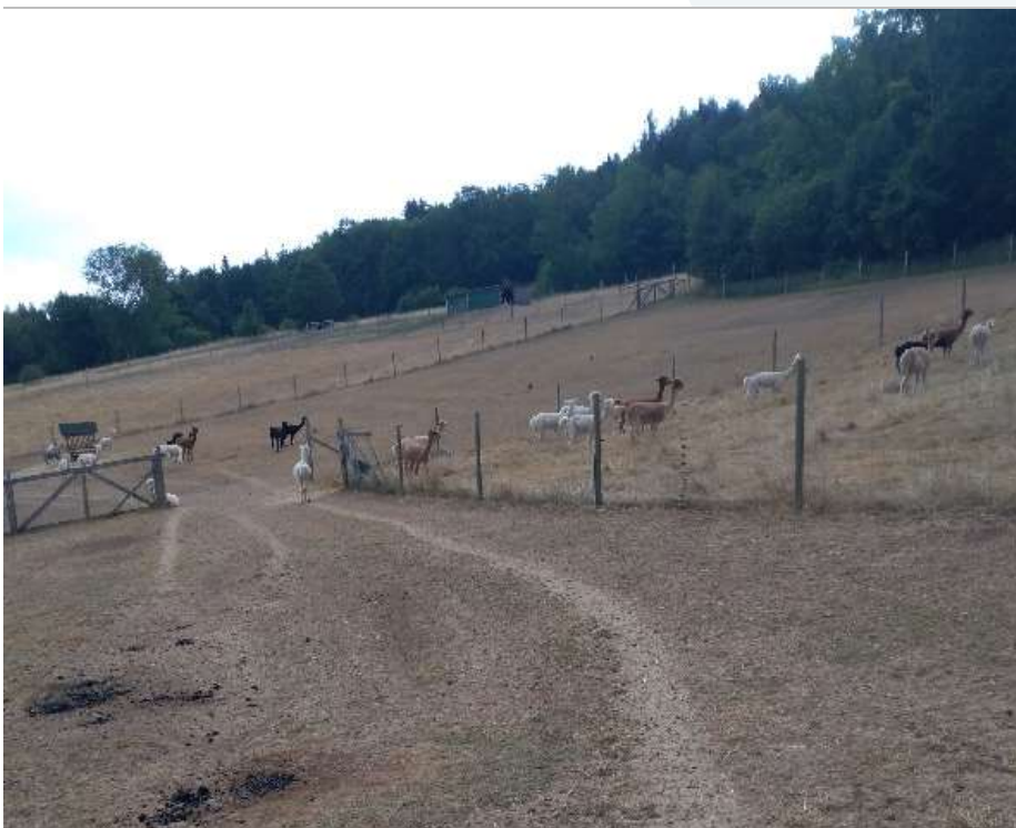
Abb. 1. Stutenherde auf einem Hang

Mithilfe von eigens erstellten Fragebögen wird versucht auf Ursachen zu schließen, die Geburtsprobleme bei Neuweltkameliden auslösen. In den Fragebögen werden verschiedene Bereiche wie Betriebsdaten, Fütterung und Anatomie der Tiere erhoben. Die gewonnenen Daten werden anschließend in einer Access Datei zusammen gefasst und miteinander verglichen. Um Verbesserungsvorschläge geben zu können wird das gewonnene Ergebnis mit Tierärzten und Züchtern besprochen.