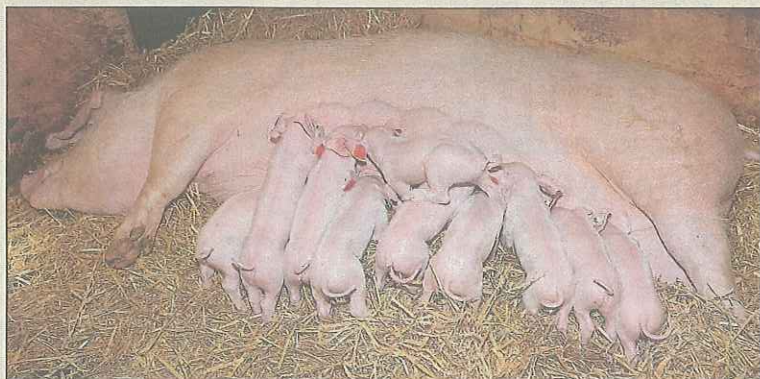
▲ Im Versuchsstall fühlen sich die Tiere trotz neuester Technik wohl.