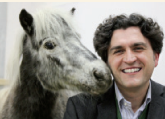
Bildtextplatzhalter, das ist ein Platzhalter für einen Bildtext.

Pferden, egal ob im Turniersport oder im Freizeitbereich. Wir als Pferdeleute verfolgen diese Ideen des Tierschutzes tagtäglich und dürfen nicht zulassen, dass diese Bemühungen kaputt geredet werden. Vielmehr müssen wir die Gedanken unserer Kritiker aufnehmen und entsprechende Strategien etablieren, die auf unabhängig erlangten Erkenntnissen, auf Wissenschaft basieren und so die Akzeptanz für unsere Auffassung von Tierschutz steigern. Ich glaube, dass eine der wichtigsten Aufgaben in diesem Zusammenhang auch darin besteht, alle Menschen mit dem Pferd vertraut zu halten. Sie sollten wenigstens über ein grundständiges Wissen über Pferde und andere landwirtschaftliche Nutztiere, ihre Bedürfnisse und Fähigkeiten, verfügen.