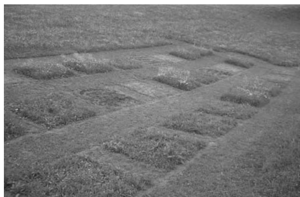
Abbildung 1: Fotos der beiden Versuchsanlagen. Oben Anger; unten Hauswiese vom 23.07.2010, nach dem 2. Schnitt der 3-Nutzungs-Varianten inklusive Gülle-Teilgabe