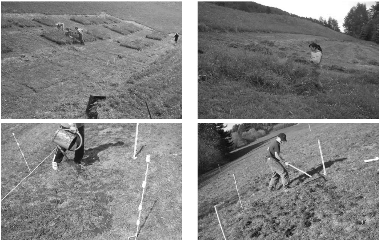
Abbildung 2: Feldarbeiten von links oben nach rechts unten: Schnitt und Ernte der Parzellen, Vegetationsaufnahme, Gülledüngung und Mistdüngung